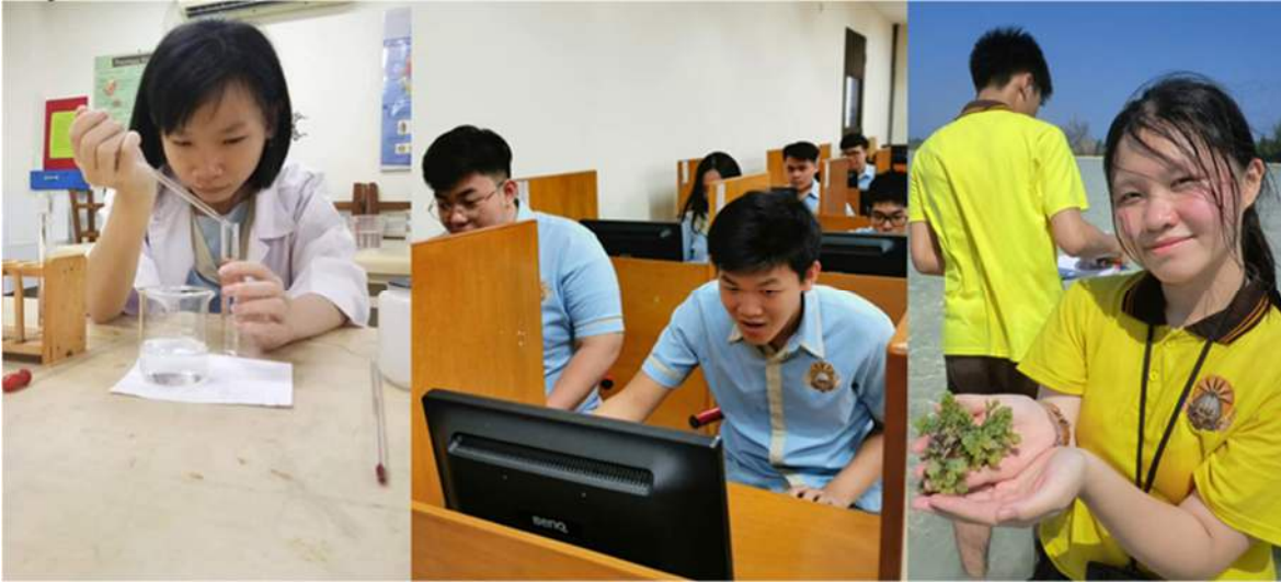
Gambar 1 Kegiatan Siswa di SMA Sinar Dharma