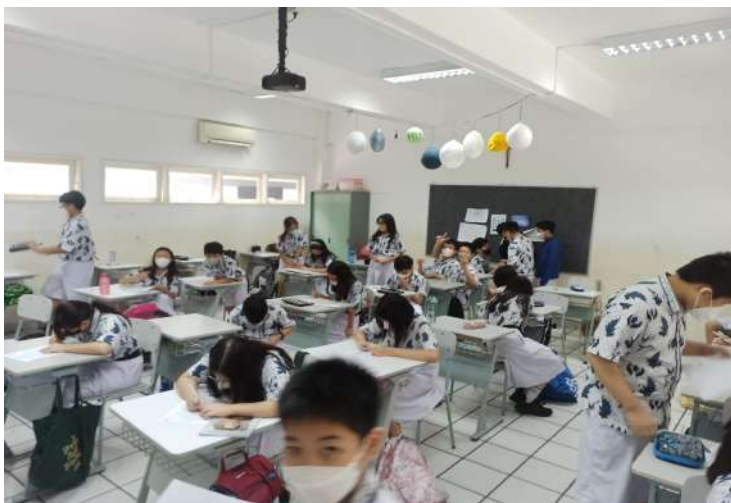
Pelaksanaan Asesmen pada SMP X II Jakarta