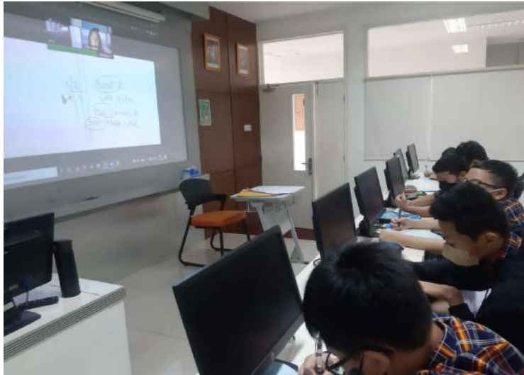
Pelaksanaan Asesmen (Data Susulan) di SMP X II Jakarta

Berdasarkan pelaksanaan kegiatan di atas, didapatkan gambaran mengenai gambaran peserta, self-concept , motivasi berprestasi serta bakat dan minat siswa di SMP X II Jakarta (kelas VII dan IX). Secara umum pada penarikan data yang dilakukan di SMP X II Jakarta peserta terdiri atas 141 siswa yang mencakup 76 siswa duduk pada bangku kelas VII (53.9 %) dan 65 siswa duduk pada bangku kelas IX (46.1 %). Dimana 73 siswa diantaranya berjenis kelamin laki-laki (51.8 %) dan 68 siswa lainnya berjenis kelamin perempuan (48.2 %). Untuk gambaran lengkapnya dapat dilihat pada Tabel 1 dan 2.