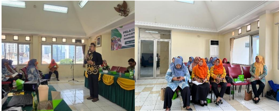
Gambar 1. Pelaksanaan sesi pemaparan materi oleh narasumber

Dalam sesi pemaparan, kader diperkenalkan pada berbagai tipe pola asuh, yaitu otoriter, permisif, otoritatif (demokratis), dan neglectful (abai), beserta karakteristik dan dampaknya terhadap perkembangan anak. Diskusi menjadi semakin dinamis ketika kader diminta mengidentifikasi praktik pengasuhan yang sering mereka temui di lapangan, seperti orang tua yang memaksa anak menghabiskan makanan tanpa mempertimbangkan sinyal kenyang, atau orang tua yang membiarkan anak jajan tanpa pengawasan gizi. Melalui proses refleksi ini, Kader menyadari bahwa pola asuh demokratis merupakan pendekatan yang paling optimal, yang sesuai dengan literatur yang menyatakan bahwa pola asuh otoritatif berkontribusi positif terhadap perkembangan anak (Aboud & Yousafzai, 2015; Tripon, 2024). Proses diskusi dan studi kasus ini menunjukkan bahwa pendekatan partisipatif memungkinkan kader mengaitkan teori dengan pengalaman nyata, sehingga pemahaman yang terbentuk menjadi lebih kontekstual dan aplikatif.