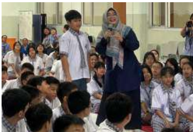
Kegiatan seminar psikoedukasi