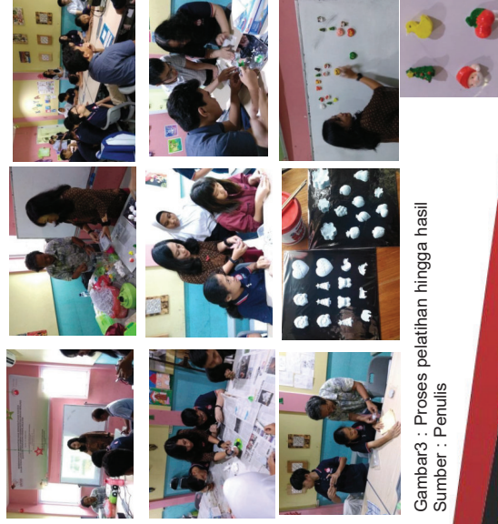
Gambar3 : Proses pelatihan hingga hasil