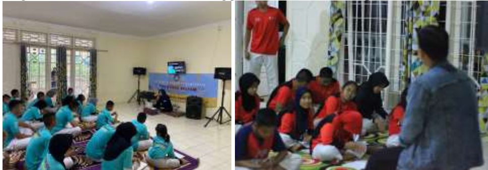
Kegiatan Latihan Edit Video Menggunakan Aplikasi CapCut

Latihan Dasar Kepemimpinan (LDK) atau lebih tepatnya adalah Latihan Dasar Kepemimpinan Organisasi (LDKO) sebagai pelatihan dasar tentang segala hal yang berkaitan dengan kepemimpinan dalam organisasi. Pelatihan yang bertujuan untuk membekali atlet-atlet tingkat atas (sabuk merah hingga hitam) agar memiliki kemampuan memimpin dan mengelola organisasi dengan baik. Kegiatan LDK dilaksanakan diluar Kota dalam waktu dua hari satu malam. Sesi pembekalan materi editing video menggunakan aplikasi CapCut menjadi salah satu materi pelatihan, dengan harapan para atlet dapat membantu mempublikasikan kegiatan Latihan rutin, Latihan khusus, kegiatan turnamen dan prestasi yang diraih, serta dapat membantu mempromosikan klub melalui platform media TikTok, Instagram, Facebook, atau yang lainnya. Dengan demikian kegiatan klub dapat lebih mudah diketahui oleh masyarakat luas yang pada akhirnya dapat diharapkan dapat meningkatkan prestise klub.