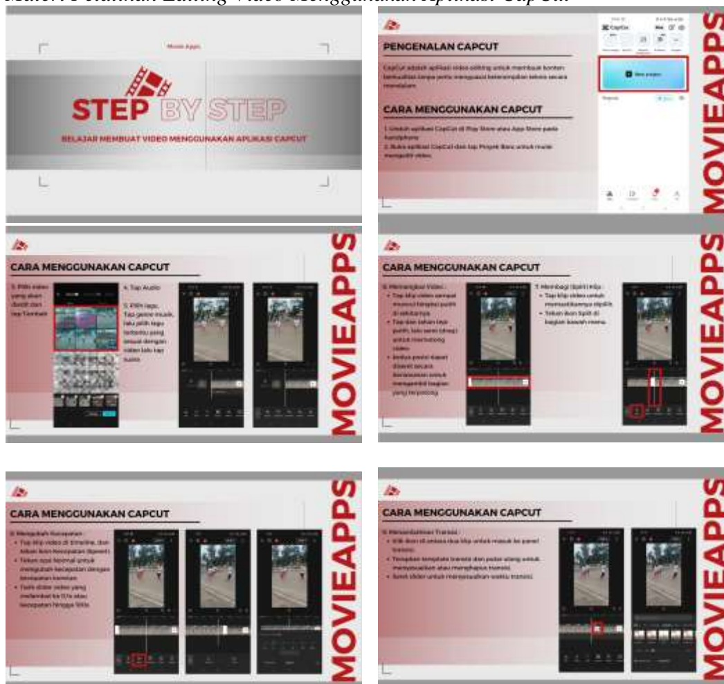
Materi Pelatihan Editing Video Menggunakan Aplikasi CapCut