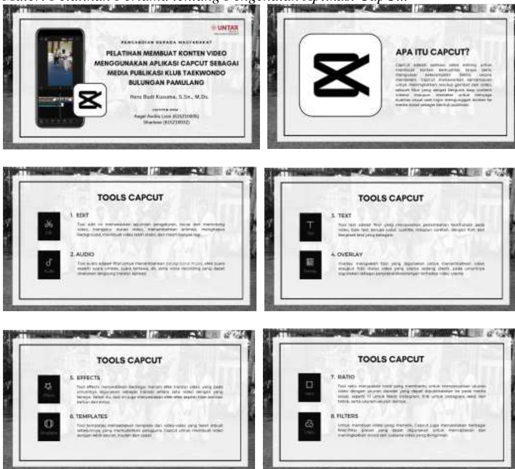
Gambar 9. Materi Pelatihan Pertama tentang Pengenalan Aplikasi CapCut