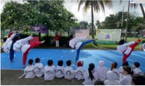
Gambar 5 . Kegiatan Latihan Poomsae

Latihan Poomsae atau Latihan rangkaian jurus adalah rangkaian teknik gerakan dasar serangan dan pertahanan diri, yang dilakukan melawan lawan yang imajiner, dengan mengikuti diagram tertentu. Setiap diagram rangkaian gerakan poomsae didasari oleh filosofi timur yang menggambarkan semangat dan cara pandang bangsa Korea.