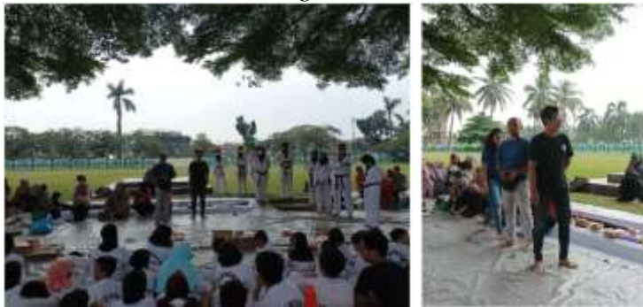
Perkenalan Tim PKM dengan Komunitas Klub Taekwondo Bulungan Pamulang

Perkenalan dilaksanakan pada kegiatan rutin dihari Minggu, karena Latihan rutin Minggu pagi hingga siang berdurasi 4 jam, mulai pukul 08.00 sampai pukul 12.00 wib. Jumlah atlet yang hadir pun lebih banyak bila dibandingkan dengan Latihan rutin pada hari Kamis yang berdurasi hanya 2 jam, mulai pukul 16.00 sampai 18.00 wib. Perkenalan ini penting sebagai ajang untuk menyampaikan maksud dan tujuan kegiatan yang dilaksanakan dan hal apa yang dapat disiapkan oleh peserta pelatihan. Selain perkenalan, Tim dapat memantau dan mendokumentasikan kegiatan Latihan para atlet taekwondo Bulungan Pamulang.