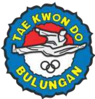
Logo Klub Taekwondo Bulungan Pamulang

Semester yang lalu telah diadakan kegiatan PKM di Klub Taekwondo Bulungan Pamulang dengan focus kegiatan untuk mem-Branding Klub Taekwondo Bulungan Pamulang. Ada enam strategi branding yang bisa dijalankan untuk menghasilkan upaya branding yang sukses dan juga berhasil: