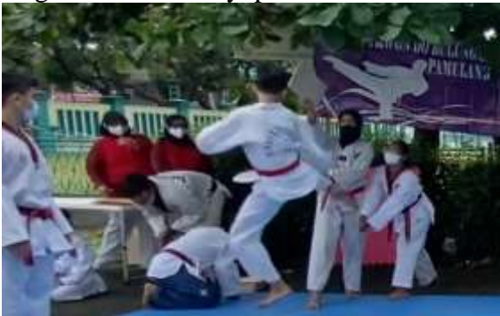
Gambar 6 Kegiatan Latihan Kyupa

Latihan Kyokpa atau Latihan teknik pemecahan adalah latihan teknik dengan memakai sasaran/objek benda mati, untuk mengukur kemampuan dan ketepatan tekniknya. Objek sasaran yang biasanya dipakai antara lain papan kayu, batu bata, genting, dan terkadang menggunakan benda yang lembut seperti kertas. Teknik tersebut dilakukan dengan tendangan, pukulan, sabetan, bahkan tusukan jari tangan.