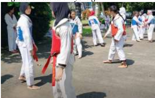
Kegiatan Latihan Kyorugi

Dasar atau kategori Kyorugi merupakan dasar pertarungan, dimana atlet diajarkan untuk meningkatkan performa fisik, meningkatkan daya reflek, mempelajari strategi bertarung dan tentunya belajar memukul dan menandang yang efektif. Atlet Kyorugi yang selalu bertarung dilengkapi dengan berbagai pelindung tubuh, seperti pelindung tangan, pelindung kaki, pelindung badan, pelindung kemaluan juga pelindung kepala (terutama saat turnamen). Taktik dan strategi bertarung yang diajarkan seperti taktik menyerang ( attack ), taktik bertahan ( counter ), maupun taktik gabungan menyerang dan bertahan ( counter-attack ).