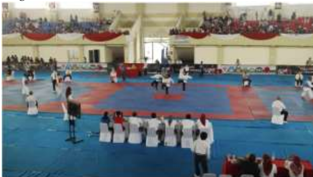
Gambar 7 Kegiatan Turnamen Poomsae

Kejuaraan Taekwondo yang dilaksanakan dari tingkat lokal, tingkat kota, tingkat provinsi, tingkat nasional adalah sebagai ajang mencari bibit-bibit atlet Taekwondo yang unggul juga sebagai sarana untuk meningkatkan prestasi atlet. Pemusatan atlet berprestasi pun dilakukan secara berjenjang, ditingkat kota dilakukan oleh masing-masing klub, ditingkat provinsi dilakukan