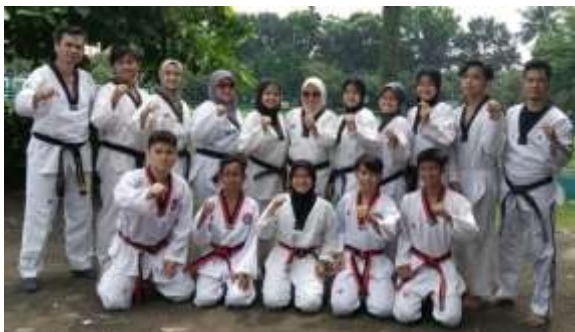
Pelatih dan Atlet Senior Klub Taekwondo Bulungan Pamulang