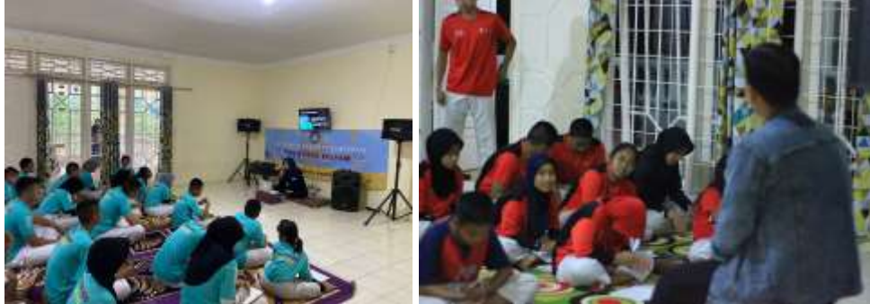
Kegiatan Latihan Edit Video Menggunakan Aplikasi CapCut

Latihan Dasar Kepemimpinan (LDK) atau lebih tepatnya adalah Latihan Dasar Kepemimpinan Organisasi (LDKO) sebagai pelatihan dasar tentang segala hal yang berkaitan dengan kepemimpinan dalam organisasi. Pelatihan yang bertujuan untuk membekali atlet-atlet tingkat atas (sabuk merah hingga hitam) agar memiliki kemampuan memimpin dan mengelola organisasi dengan baik. Kegiatan LDK dilaksanakan diluar Kota dalam waktu dua hari satu malam. Sesi pembekalan materi editing video menggunakan aplikasi CapCut menjadi salah satu materi pelatihan, dengan harapan para atlet dapat membantu mempublikasikan kegiatan Latihan rutin, Latihan khusus, kegiatan turnamen dan prestasi yang diraih, serta dapat membantu mempromosikan klub melalui platform media TikTok, Instagram, Facebook, atau yang lainnya. Dengan demikian kegiatan klub dapat lebih mudah diketahui oleh masyarakat luas yang pada akhirnya dapat diharapkan dapat meningkatkan prestise klub.