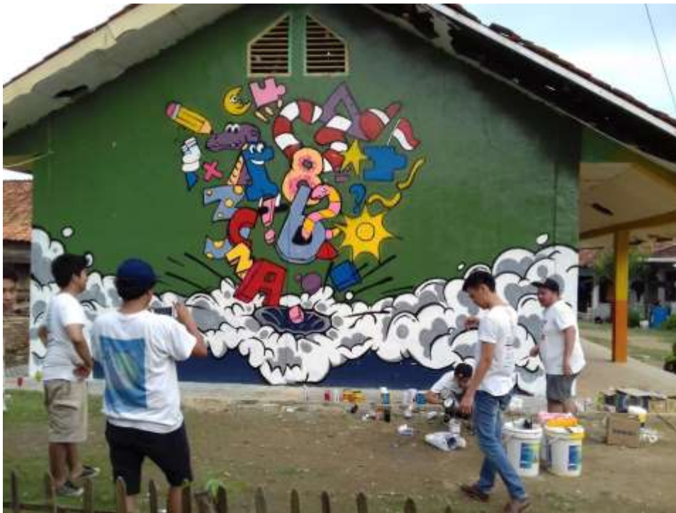
Gambar 9 Proses Okumentasi dan Finishing

Setelah desain berhasil ditransfer, tahap berikutnya adalah pengecatan. Pada tahap ini, Tim akan mulai mengaplikasikan cat ke dinding mengikuti desain yang telah dipindahkan. Disarankan untuk memulai dari bagian yang lebih besar dan latar belakang terlebih dahulu, kemudian melanjutkan ke detail-detail yang lebih kecil. Proses pengecatan ini memerlukan ketelitian dan kesabaran, karena kesalahan kecil dapat merusak keseluruhan desain. Untuk mendapatkan efek yang diinginkan, seniman sering kali menggunakan berbagai teknik pengecatan, seperti teknik sapuan kuas, teknik semprot, atau teknik sponge . Selesai proses mengecat, tahap akhir adalah penyelesaian dan perlindungan. Pada tahap ini, seniman akan melakukan sentuhan akhir untuk memperbaiki detail yang mungkin terlewatkan dan memastikan bahwa warna dan bentuk pada mural sudah sesuai dengan yang diinginkan. Setelah itu, penting untuk melindungi mural agar dapat bertahan lebih lama. Penggunaan lapisan pelindung seperti varnish atau sealer dapat membantu melindungi cat dari cuaca, debu, dan kerusakan fisik lainnya. Selain itu, penyimpanan dokumentasi tentang proses pembuatan mural juga menjadi hal yang penting, baik untuk arsip pribadi maupun untuk publikasi di media sosial atau pameran.