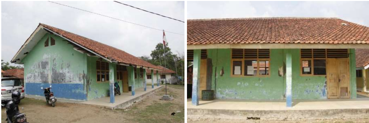
Gambar 2 Gedung Sekolah Tampak Lusuh

Mural merupakan seni lukis yang diaplikasikan pada dinding atau permukaan besar lainnya, yang tidak hanya berfungsi sebagai hiasan, tetapi juga sebagai media penyampaian pesan moral dan budaya. Mural dapat menjadi sarana untuk menghias dinding-dinding lusuh, mengubahnya menjadi ruang yang lebih hidup dan bermakna. Dengan pendekatan yang tepat, mural dapat berfungsi sebagai sebuah karya seni yang tidak hanya estetis tetapi juga edukatif. Dengan adanya pembuatan terbaru, dan menghadirkan kembali yang lebih baru dan bagus berharap anak-anak bisa bermain sambil belajar kembali dengan baik. (Kholilah, Naufa, & Ghifari, 2022).