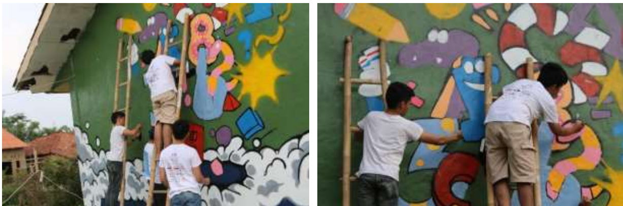
Gambar 8 Cat Semprot digunakan untuk Memberi Kesan Tiga Dimensi

Selain komposisi warna, komposisi bentuk juga memiliki peranan penting dalam menciptakan mural yang menarik. Bentuk-bentuk yang digunakan dalam mural harus mampu berinteraksi harmonis satu sama lain, sehingga menciptakan suatu kesatuan visual yang kuat. Setelah semua persiapan dilakukan, tahap selanjutnya adalah transfer desain ke dinding. Ada beberapa teknik yang dapat digunakan untuk mentransfer desain dari sketsa ke dinding. Salah satu teknik yang umum digunakan adalah metode grid, di mana sketsa dibagi menjadi kotak-kotak kecil yang kemudian dicocokkan dengan dinding. Teknik lain yang sering digunakan adalah proyek gambar, di mana sketsa diletakkan di depan proyektor dan gambar akan diproyeksikan ke dinding untuk kemudian ditelusuri.