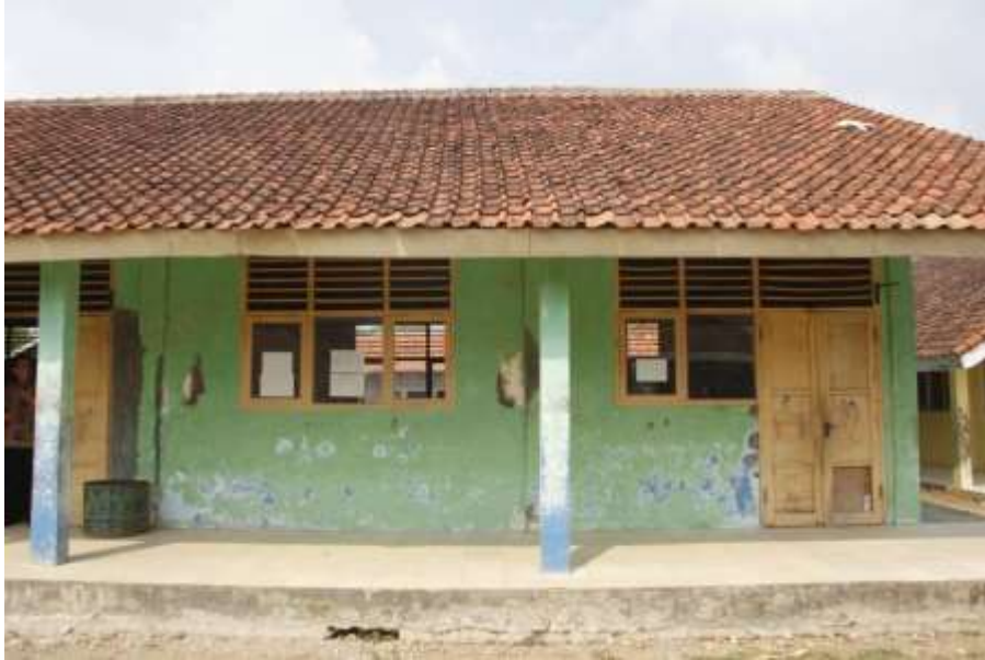
Gedung Sekolah SDN Babakan Raden 01 Cariu Kabupaten Bogor