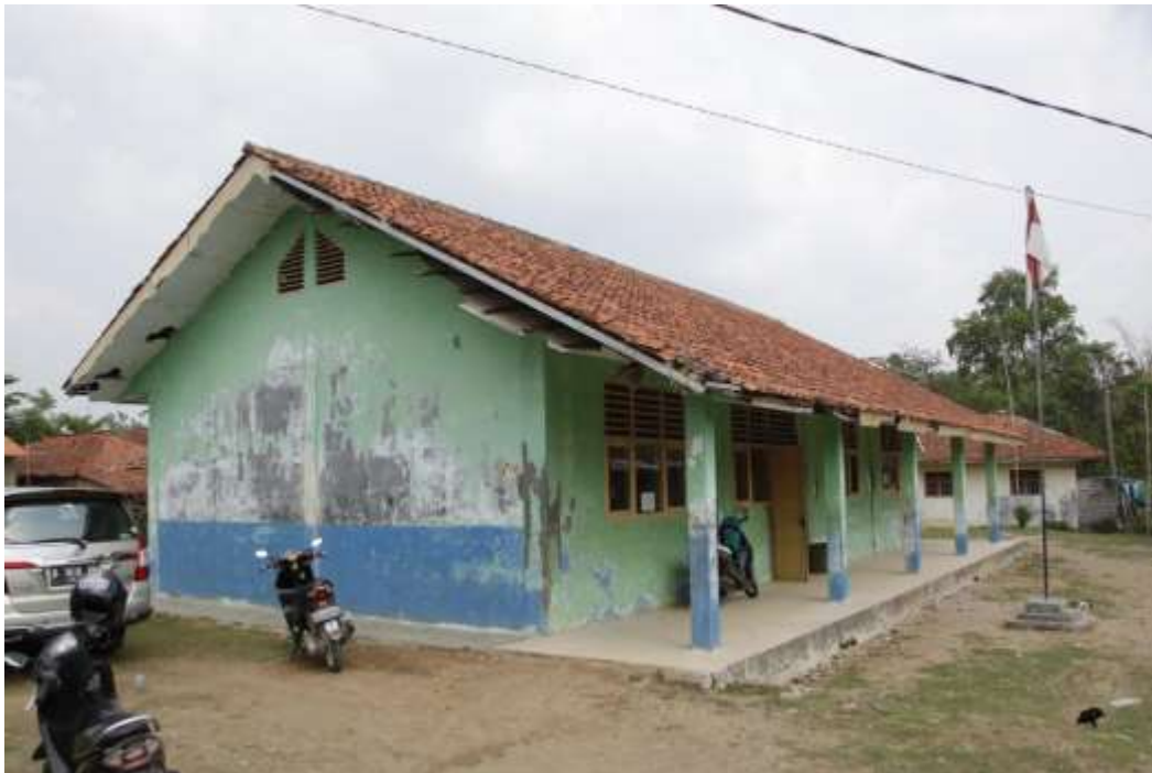
Gambar 1 Dinding Gedung Sekolah yang akan di Buatkan Karya Mural

Mural sebagai bagian dari Program Pengabdian kepada Masyarakat merupakan salah satu implementasi dari Tri Dharma Perguruan Tinggi. Melalui program mural diharapkan civitas academica bisa memberikan kontribusi bagi masyarakat dalam mendukung program pemerintah dalam hal ini adalah sosialisasi Perilaku Hidup Bersih dan Sehat. Mitra kami dalam kegiatan PKM ini adalah SDN Babakan Raden 01 Cariu, Kampung Palasari, Desa Sukajadi, Kecamatan Cariu, Kabupaten Bogor, Provinsi Jawa Barat. Dari hasil observasi, diketahui bahwa mitra memiliki dinding kosong dibagian sisi Gedung sekolah yang sudah tampak kumuh karena cat dindingnya sudah mengelupas sehingga kurang sedap dipandang. Pihak mitra sudah lama memiliki keinginan untuk mengolah dinding kosong tersebut dengan menggambarnya agar terlihat bersih dan indah. Gambar yang diterapkan memiliki tema yang berkaitan dengan dunia Pendidikan, namun untuk mewujudkan gambar didinding terkendala dengan sumber daya yang dimiliki.