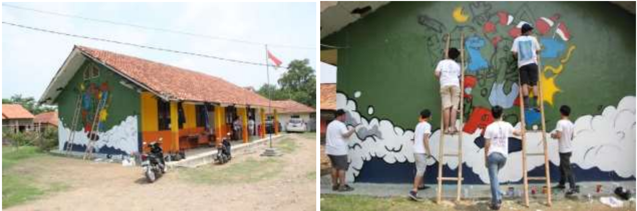
Gambar 7 Membuat Detail Gambar Mural

menyampaikan pesan atau emosi tertentu. Komposisi warna dalam mural juga menjadi salah satu elemen penting yang harus diperhatikan. Warna memiliki kemampuan untuk membangkitkan emosi dan menarik perhatian. Dalam memilih palet warna, tim harus mempertimbangkan tidak hanya keserasian warna, tetapi juga bagaimana warna tersebut dapat mendukung tema yang ingin diangkat. Misalnya, penggunaan warna-warna cerah dapat menciptakan suasana yang energik dan positif, sedangkan warna-warna gelap dapat memberikan kesan yang lebih serius dan mendalam.