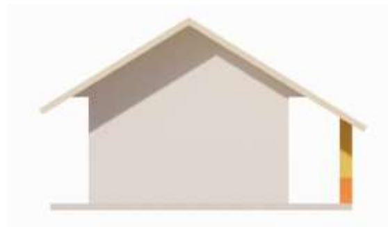
Gambar 3 Gambar Rencana Dinding yang akan di Mural

ke dinding, tetapi melibatkan berbagai tahap yang harus dilalui untuk menghasilkan karya yang estetik dan bermakna. Berikut adalah tahap-tahap dalam membuat mural.