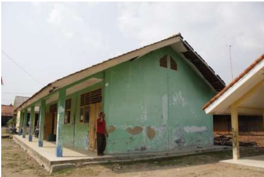
Dinding Gedung Sekolah Sebelum Dibuatkan Karya Mural