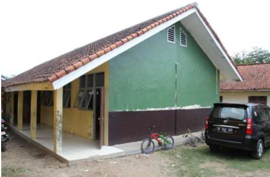
Cat Dasar sebagai Persiapan Dinding Sekolah