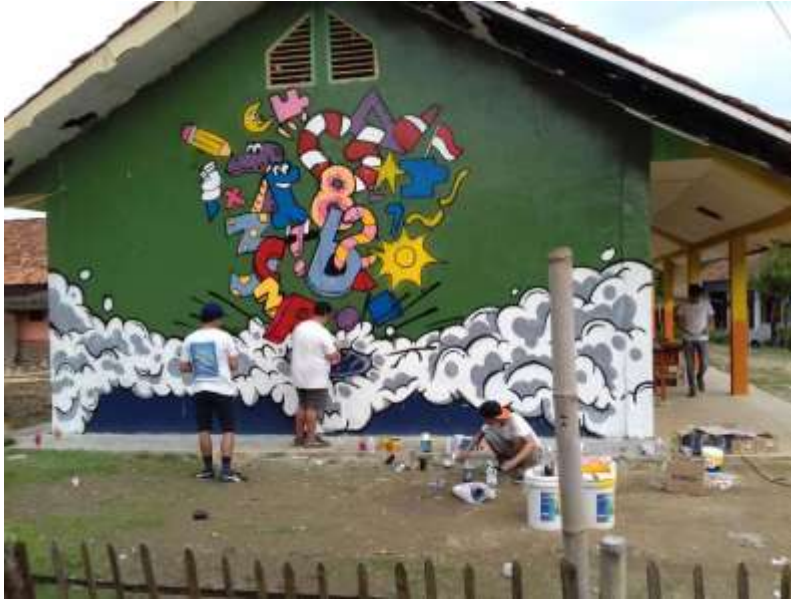
Gambar 6 Aplikasi Gambar dan Pewarnaan Mural

Setelah sketsa tergambar, tahap berikutnya adalah menentukan teknik pengecatan yang akan digunakan. Ada beberapa teknik dalam mengecat mural, di antaranya adalah teknik kuas, spray paint, dan teknik stensil. Teknik kuas adalah cara tradisional yang sering digunakan oleh seniman mural. Dengan kuas, seniman memiliki kendali penuh atas detail dan tekstur yang dihasilkan. Namun, penggunaan kuas memerlukan ketelitian dan waktu yang lebih lama, terutama untuk area yang luas. Dalam dunia mural, alat mural yang digunakan sangat beragam. Mulai dari cat akrilik, spray paint, hingga teknik stensil, setiap alat memiliki karakteristik dan kegunaan yang berbeda. Pemilihan alat yang tepat akan mempengaruhi hasil akhir dari mural itu sendiri. Selain itu, teknis penggunaan alat juga memerlukan keterampilan dan pengalaman, agar dapat menghasilkan karya yang berkualitas. Selama proses pengecatan, tim juga harus menjaga kebersihan area kerja. Pastikan bahwa tetesan cat atau percikan tidak merusak area di sekitar mural. Penggunaan pelindung seperti kain atau plastik dapat membantu menjaga kebersihan area tersebut. Selain itu, menggunakan alat bantu seperti tangga yang stabil dan perlengkapan keselamatan seperti masker dan sarung tangan juga penting untuk menjaga keselamatan seniman selama proses pengecatan.