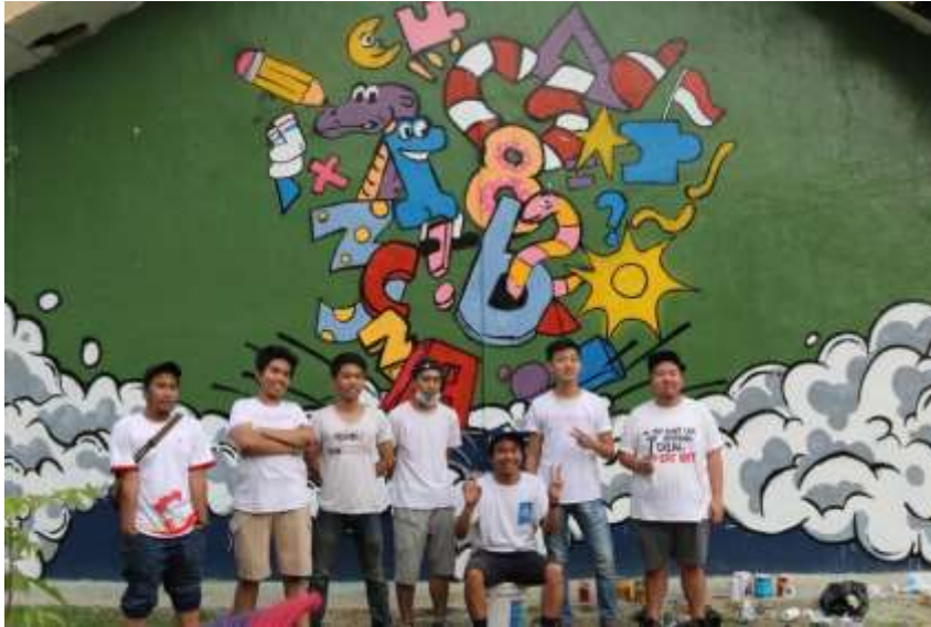
Gambar 10 Tim Pembuat Karya Mural

Karya mural harus memuat kontekstualisasi karya kreatif dalam kaitannya dengan apa yang dimaksud dengan melihat dan merasakan karya mural dalam ruang realitas sosial budaya. Menciptakan berbagai macam karya mural dengan tema dan nilai keindahan menghadirkan pengalaman keindahan bagi setiap orang dalam ruang realitas sosial budaya. Teknik produksi lukisan mural yang memanfaatkan keseriusan dan ketrampilan pelukis secara maksimal. Menampilkan pelukis Inggris menciptakan karya seni mural yang memamerkan kekayaan mereka. Menguasai teknik menciptakan karya seni mural yang mendorong imajinasi terhadap apa yang dilukis pada permukaan kanvas (Wiratno, 2022). Proses mengecat mural adalah kegiatan seni yang melibatkan penerapan cat pada permukaan dinding atau media lain untuk menciptakan gambar atau motif yang menarik. Mural biasanya memiliki ukuran yang besar dan dapat ditemukan di berbagai tempat, seperti gedung, rumah, ruang publik, dan banyak lagi. Untuk menghasilkan mural yang berkualitas, diperlukan pemahaman mendalam mengenai teknik pengecatan, pemilihan warna, dan cara mewarnai motif yang tepat.