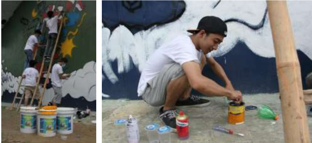
Gambar 5 Alat dan Bahan Cat serta Perlengkapan Bantu

Ketika warna diterapkan, penting untuk memperhatikan lapisan cat. Mural sering kali memerlukan beberapa lapisan cat untuk mencapai kecerahan warna yang diinginkan. Penggunaan cat akrilik adalah pilihan umum karena cepat kering dan tahan lama. Namun, harus dipastikan untuk memberikan waktu pengeringan yang cukup antara setiap lapisan untuk menghindari pengelupasan atau pencampuran warna yang tidak diinginkan. Setelah persiapan dinding selesai, tim mulai menerapkan sketsa awal pada dinding. Teknik yang umum digunakan adalah teknik grid, di mana tim membagi sketsa menjadi kotak kecil dan menggambar ulang pada dinding sesuai dengan ukuran aslinya.