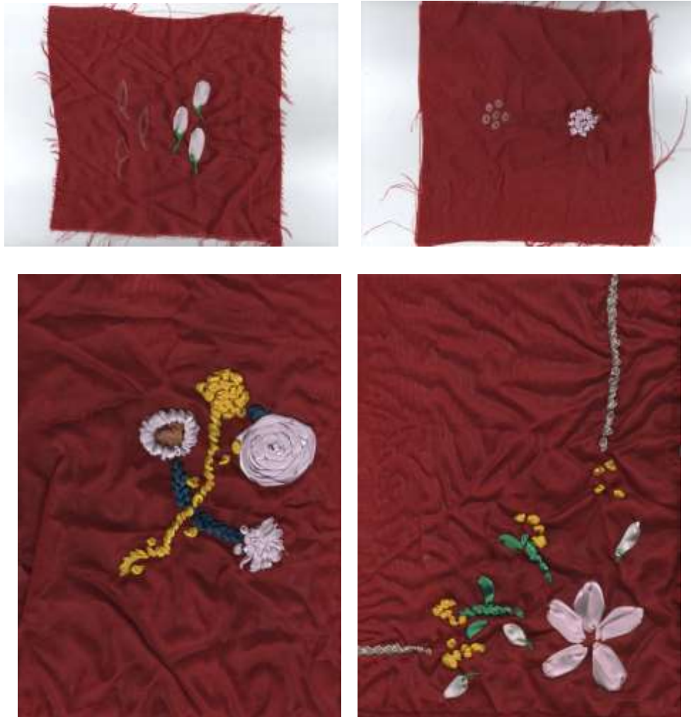
Pola Sulam Pita Sederhana

Salah satu alasan para ibu mengikuti kegiatan Pelatihan Sulam Pita adalah untuk mengadopsi berbagai hal dalam partisipasi mereka tidak dengan alasan yang bersifat keuntungan material ( instrumentally ), namun lebih didasarkan pada rasa kenyamanan dalam bersosialisasi dan terbukanya pikiran mereka ( mind set ) dalam menghadapi berbagai permasalahan. Pada tataran kelompok ini tindakan rasional yang muncul adalah rasionalitas value. Rasionalitas ini menduduki peranan penting dalam struktur komunikasi sosial. Tindakan sosial ini didasarkan dominansi berorientasi pada berbagai pilihan yang bersumber dari tindakan yang bersifat normatif dan memiliki tujuan atas dasar pertimbangan aktivitas mereka berkaitan dengan pengumpulan