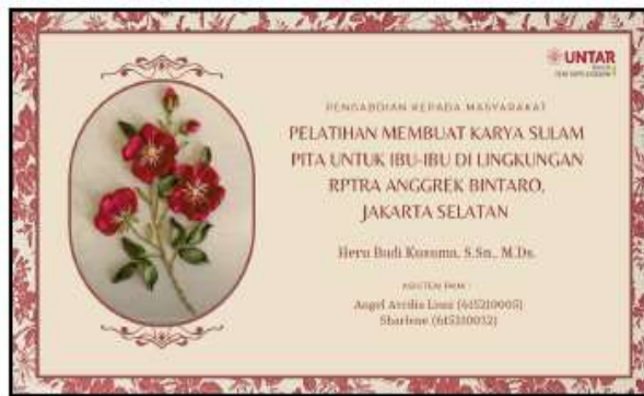
Gambar 1. Materi Pelatihan Sulam Pita

Kegiatan pengabdian kepada masyarakat dilaksanakan pada hari Sabtu, 09 September 2023 yang diawali dengan acara pembukaan dan perkenalan Tim PKM dari Universitas Tarumanagara dengan para ibu peserta pelatihan. Durasi waktu pelaksanaan dimulai pukul 08.00 wib dan berakhir pada pukul 12.00 wib. Penyampaian materi menggunakan media laptop dan proyektor yang diarahkan ke dinding ruangan dan aplikasi penyampaian materi menggunakan Canva. Materi yang disampaikan mencakup; mengenal alat-alat yang dibutuhkan dan bahan untuk membuat karya sulam pita, macam-macam jenis tusukan pita, cara membuat pola dan membuat karya sulam pita dengan bahan pita Satin berukuran 1 Cm dan 2 Cm. Materi Pelatihan yang disampaikan adalah sebagai berikut: