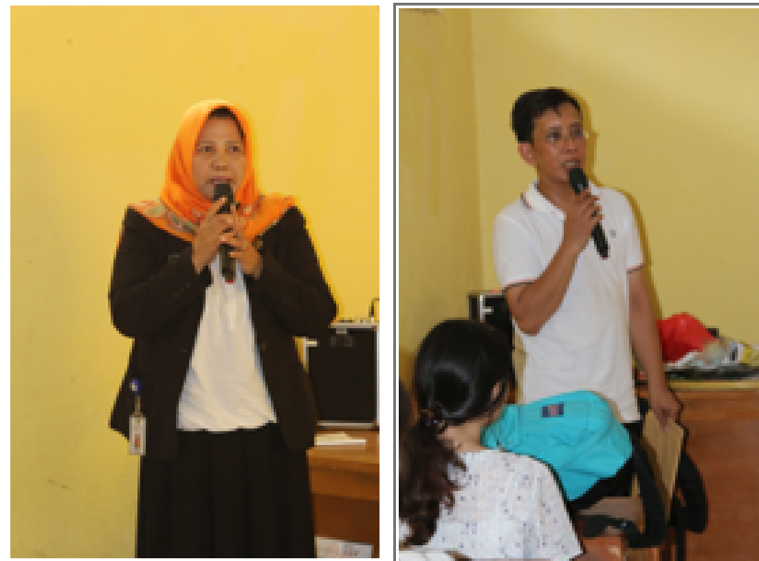
Gambar 2 Sambutan Kepala sekolah dan Ketua Tim PKM