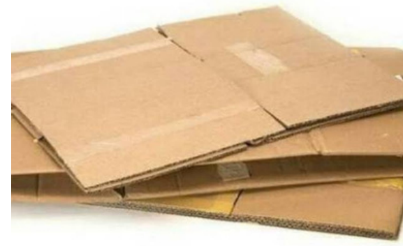
Kardus Bekas jenis double wall