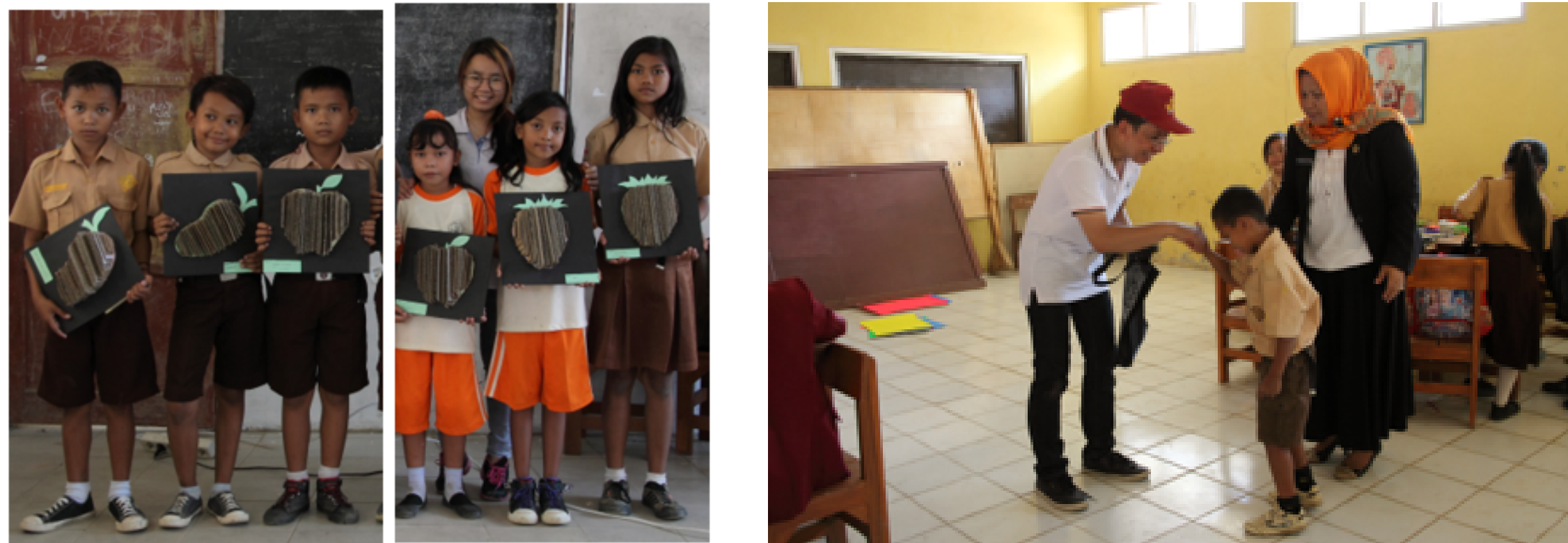
Gambar 4 Melakukan sesi dokumentasi bersama dengan siswa dan Tim PKM dan siswa berpamitan dengan para guru dan Tim PKM Dokumentasi Pribadi