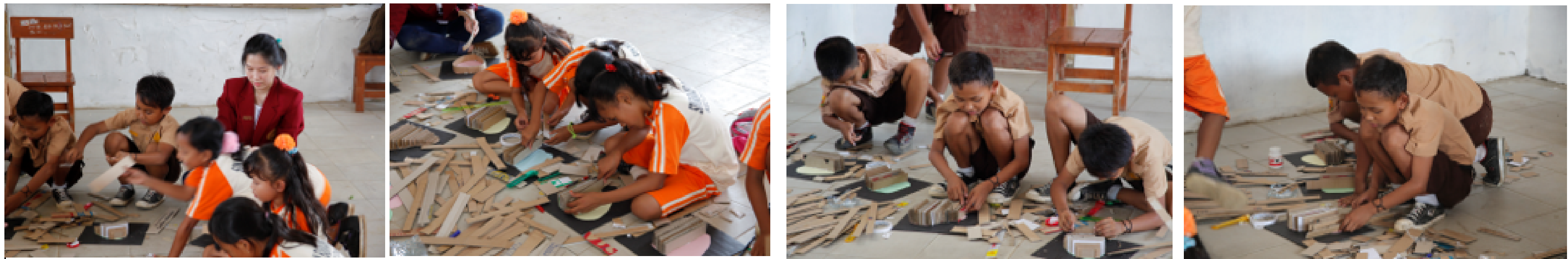
Gambar 3 Tim PKM melakukan pendampingan terhadap siswa dalam proses pembuatan kreasi 3D menggunakan kardus bekas