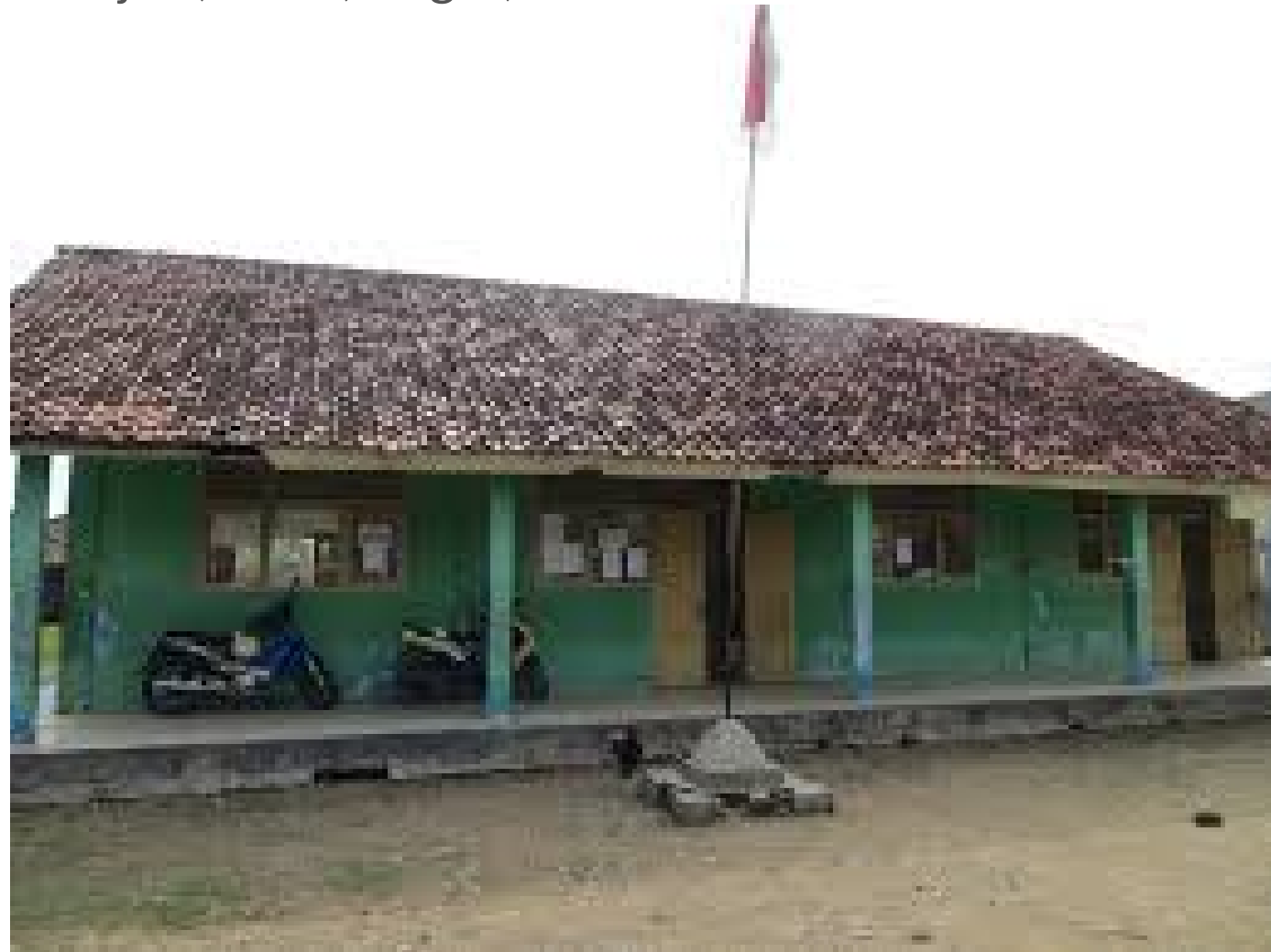
Gambar 1 Gedung Sekolah SDN Babakan Raden 01 Cariu Dokumentasi Pribadi

SDN BABAKAN RADEN 01 CARIU Sukajadi, Cariu, Bogor, Jawa Barat 16840