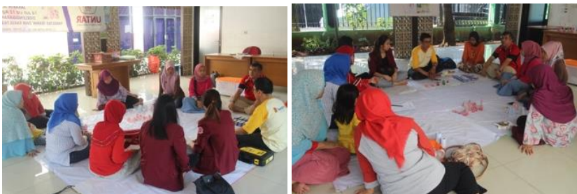
Gambar 1. Persiapan kegiatan ibu-ibu PKK sebagai peserta pelatihan