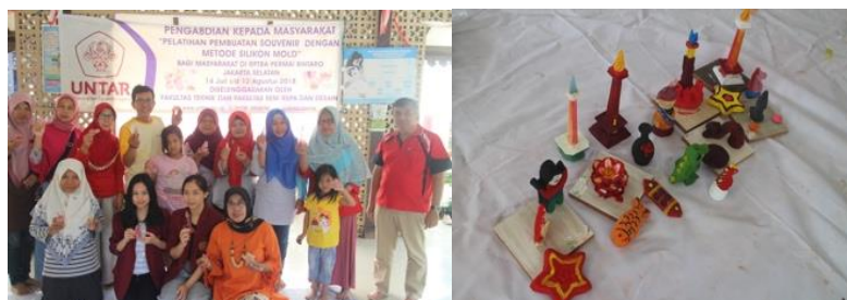
Gambar 6. Peserta pelatihan dan karya yang dihasilkan

Hasil pelatihan mewarnai dengan menggunakan cat akrilik mendapatkan hasil yang beragam, dimana ada karya peserta pelatihan yang hasilnya kurang maksimal, namun adapula yang dapat memberikan hasil karya yang cukup baik. Proses mencampur dan menerapkan warnanya pun demikian, ada yang monokromatik namun ada pula yang mampu menampilkan karya dengan komposisi warna analogus.