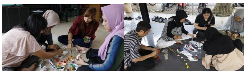
Gambar 3. Kegiatan mewarnai menggunakan cat akrilik

Cat akrilik merupakan pigmen yang pertama kali dibuat pada awal abad ke-20 oleh ahli kimia dan pengusaha Jerman Otto Röhm. Pertama kali cat akrilik tersedia untuk masyarakat umum yaitu pada tahun 1950 an. Resin ini memiliki berbagai macam sifat, seperti ketahanan air yang luar biasa, dan daya tahan yang luar biasa saat mengering, yang menjadikannya bahan yang sempurna untuk cat. Kegiatan mewarnai bertujuan untuk melatih keterampilan, kerapian dan kesabaran. Teknik mewarnai yang efektif dengan cara mencampur warna dan mengetahui warna kontras (terang), cara membuat gradasi dan tehnik mengarsir (Sumarni et al. , 2023).