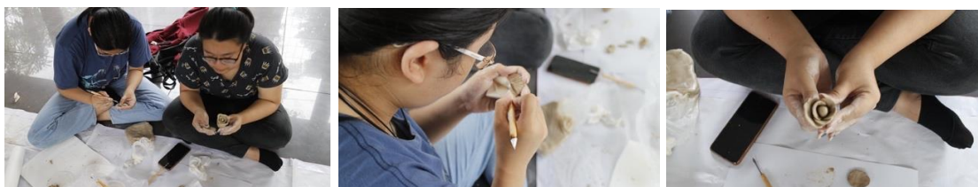
Gambar 2. Peserta membuat karya dari bahan tanah liat

Pelatihan untuk mengecat karya dengan membuat benda atau karyanya terlebih dahulu. Kegiatan pertama, peserta pelatihan membuat model dengan menggunakan tanah liat mulai dengan mengolah tanah agar lebih lentur dan ulet sehingga mudah dibentuk dan tidak mudah patah. Caranya dengan meremas tanah, mengulenin tanah dan menggilas tanah. Bila kekenyalan dan keuletan tanah sudah baik, maka dilanjutkan dengan membentuk tanah liat menjadi model yang diinginkan, seperti bentuk miniatur Monumen Nasional (Monas), hewan kura-kura, buah manggis dan lain sebagainya.