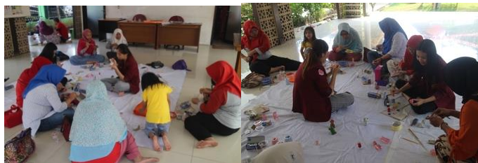
Gambar 4. Mahasiswa melakukan pendampingan mewarnai

Selain untuk mewarnai benda-benda dari kanvas atau kain, cat akrilik dapat pula digunakan di permukaan yang datar dari objek yang terbuat dari tanah liat atau resin. Untuk mewarnai permukaan datar dari sebuah objek dapat digunakan metode pewarnaan plakat, yaitu teknik mewarnai menggunakan cat akrilik dengan cara sapuan warna yang tebal atau kental sehingga hasilnya terlihat padat atau pekat dan menutup pori-pori bendanya.