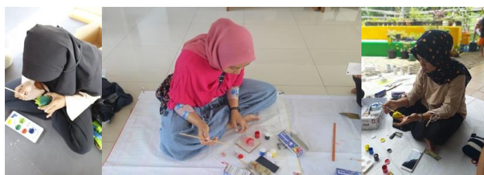
Gambar 5. Peserta menerapkan komposisi warna analogus

Selain untuk mewarnai benda-benda dari kanvas atau kain, cat akrilik dapat pula digunakan di permukaan yang datar dari objek yang terbuat dari tanah liat atau resin. Untuk mewarnai permukaan datar dari sebuah objek dapat digunakan metode pewarnaan plakat, yaitu teknik mewarnai menggunakan cat akrilik dengan cara sapuan warna yang tebal atau kental sehingga hasilnya terlihat padat atau pekat dan menutup pori-pori bendanya.