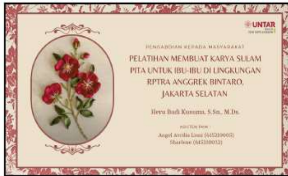
Gambar 1. Materi Pelatihan Sulam Pita

Kegiatan pengabdian kepada masyarakat dilaksanakan pada hari Sabtu, 09 September 2023 yang diawali dengan acara pembukaan dan perkenalan Tim PKM dari Universitas Tarumanagara dengan para ibu peserta pelatihan. Durasi waktu pelaksanaan dimulai pukul 08.00 wib dan berakhir pada pukul 12.00 wib. Penyampaian materi menggunakan media laptop dan proyektor yang diarahkan ke dinding ruangan dan aplikasi penyampaian materi menggunakan Canva. Materi yang disampaikan mencakup; mengenal alat-alat yang dibutuhkan dan bahan untuk membuat karya sulam pita, macam-macam jenis tusukan pita, cara membuat pola dan membuat karya sulam pita dengan bahan pita Satin berukuran 1 Cm dan 2 Cm. Materi Pelatihan yang disampaikan adalah sebagai berikut: