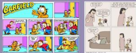
gambar contoh komik Garfield tahun 1983 di media cetak dan komik Tahi Lalat pada media digital https://thehundreds.com/blog/content/the-true-meaning-of-garfield https://newstempo.github.io/kabar/post/komik-tahi-lalat/

Komik strip adalah bentuk komik yang terdiri dari satu atau beberapa panel gambar yang biasanya disusun secara horizontal atau vertikal. Strip komik biasanya ditemukan di surat kabar, majalah, atau dalam format daring. Komik strip sering kali memiliki karakter utama yang muncul secara teratur, dan ceritanya berkembang dalam beberapa panel singkat. Komik strip umumnya memiliki tujuan untuk menghibur pembaca dengan lelucon, satire, atau observasi tentang kehidupan sehari-hari. Dengan perkembangan teknologi, banyak juga komik strip yang dapat diakses secara daring melalui sosial media dan situs lainnya.