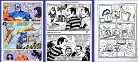
gambar contoh berbagai komik

"Komik" adalah istilah yang digunakan untuk menyebut karya seni yang menggabungkan gambar dan teks dengan cara naratif untuk menceritakan suatu cerita. Komik dapat berupa buku komik (comic book), strip komik (comic strip), manga, atau bentuk-bentuk lainnya. Gaya dan format komik bervariasi, tetapi umumnya terdiri dari panel-panel gambar yang disusun secara berurutan dengan teks naratif atau dialog yang mendukung alur cerita. Komik dapat memuat dan menyampaikan pesan yang beragam. Tema dan tujuan dalam membuat komikpun dapat sangat berbeda satu dengan yang lainnya. Salah satu variasinya adalah silent manga atau komik tanpa teks verbal.