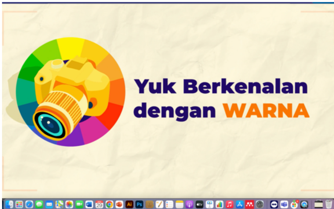
Gambar 5.Materi PKM SMA Santo Kristoforus 1.