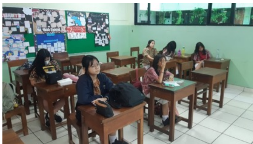
Gambar 2. Siswa SMA Santo Kristoforus 1 dalam PKM

Dalam pelaksanaan kegiatan pelatihan ini tim mempersiapkan materi pelatihan fotografi dengan mengenalkan sejarah fotografi, tokoh-tokoh dalam fotografi serta temuannya baru masuk setelahnya masuk ke materi tentang warna dalam fotografi. Hal ini akan memberikan wawasan pengetahuan bagi peserta pelatihan agar mengetahui proses temuan dalam dunia fotografi dan kaitannya dengan warna dalam fotografi.