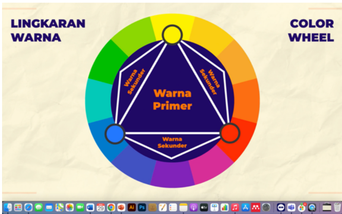
Gambar 6.Materi PKM SMA Santo Kristoforus 1. Sumber: Penulis, 2023