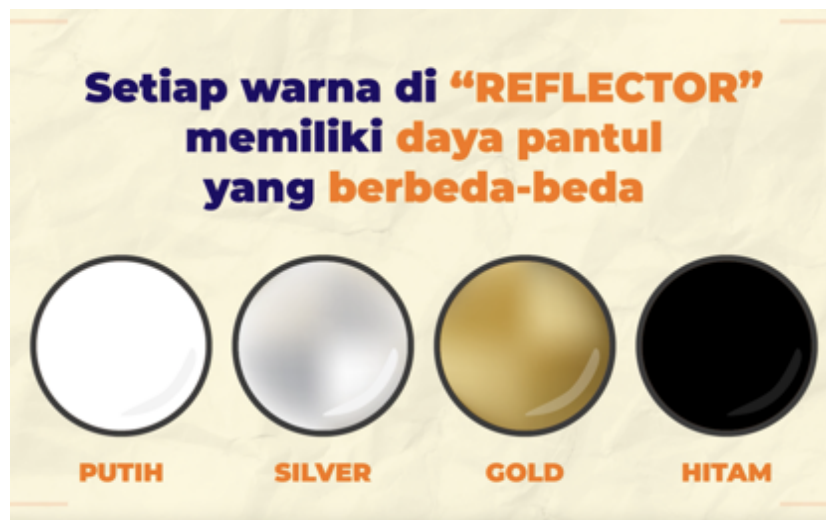
Gambar 7. Materi PKM SMA Kristen IPEKA BSD