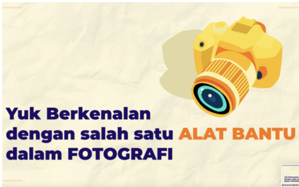
Gambar 5.Materi PKM SMA Kristen IPEKA BSD