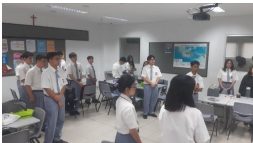
Gambar 2. Siswa SMA Kristen IPEKA BSD pada Kegiatan PKM

Dalam pelaksanaan kegiatan pelatihan ini tim mempersiapkan materi pelatihan fotografi dengan mengenalkan sejarah fotografi, tokoh-tokoh dalam fotografi serta temuannya baru masuk setelahnya masuk ke materi tentang element visual dalam fotografi. Hal ini akan memberikan wawasan pengetahuan bagi peserta pelatihan agar mengetahui proses temuan dalam dunia fotografi dan kaitannya dengan warna dalam fotografi.