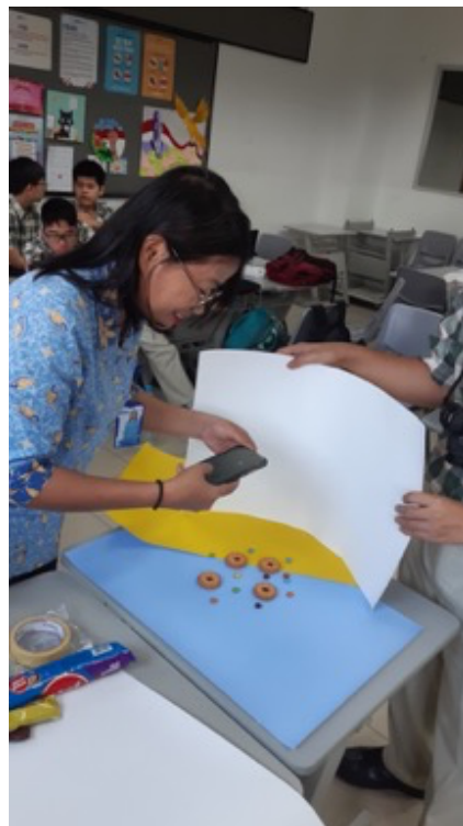
Gambar 4. Materi PKM SMA Kristen IPEKA BSD