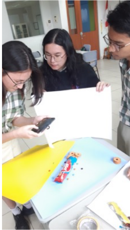
Gambar 3. Bukti PKM SMA Kristen IPEKA BSD