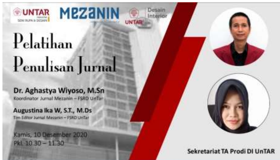
Gambar 1. Poster Pelatihan Penulisan Jurnal