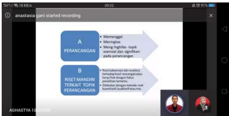
Gambar 2. Capture Slide Pelatihan Jurnal