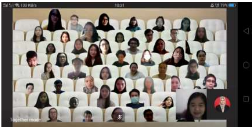
Gambar 4. Capture together mode Pelatihan Jurnal