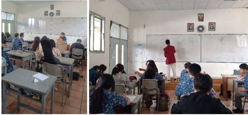
Materi Paparan mengenai Illustrative Typography kepada siswa-siswi SMA Kristen Kalam Kudus II