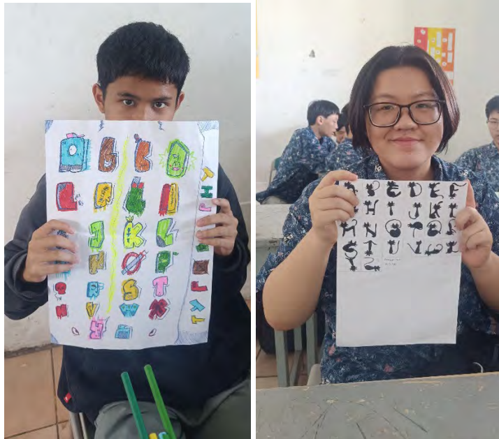
Hasil akhir 1 set alfabet dengan tema tertentu yang dilakukan oleh peserta didik