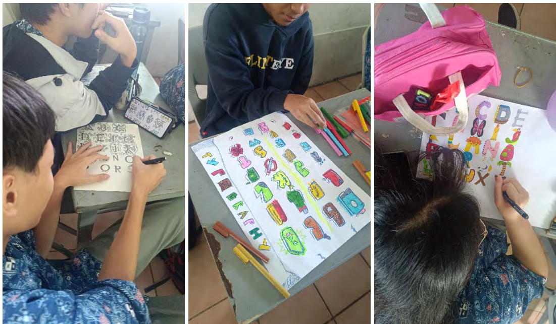
Peserta didik SMA Kristen Kalam Kudus II membuat 1 set alfabet dan mengaplikasikan warna terhadap set alfabet yang sudah dibuat