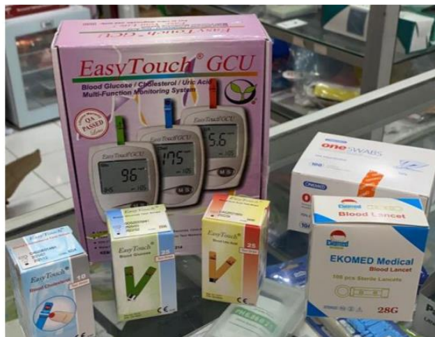
Bantuan paket alat POCT GDS, kolesterol dan asam urat