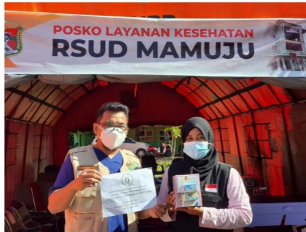
Pemberian bantuan PP PDS PatKLIIn berupa alat POCT ke posko kesehatan RSUD Mamuju