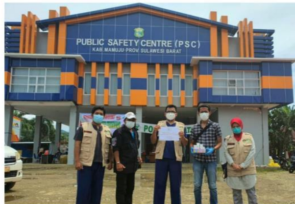
Pemberian bantuan PP PDS PatKLIIn berupa alat POCT ke posko kesehatan PSC 119 Kabupaten Mamuju