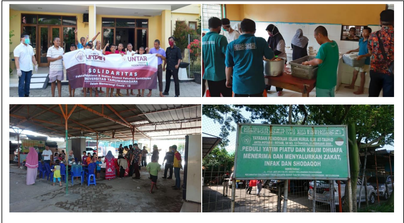
Gambar 2. Suasana pembagian bantuan makan siang di panti sosial bina grahita belaian kasih (atas) dan panti asuhan yayasan pendidikan Islam Nurul Ilmi At-Tauhid (bawah).

Grahita Belaian Kasih (17 April 2020) serta Panti asuhan Yayasan Pendidikan Islam Nurul Ilmi AT.Tauhid (22 April 2020) di wilayah Jakarta Barat. (Gambar 2)