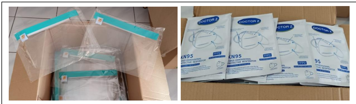
Gambar 1. Sebagian donasi berupa face shield dan masker N95 yang terkumpul.

Kedua permasalahan ini menggugah para alumni FK UNTAR yg tergabung dalam keluarga alumni medis Universitas Tarumanagara untuk menggalang dana. Penggalangan dana yang merupakan kerjasama antara FK.UNTAR dan alumni berhasil mengumpulkan dana dari alumni, mahasiswa FK UNTAR dan orang2 di luar FK.UNTAR. Selain dalam bentuk uang, donasi yang diterima berupa APD (Coverall, masker N95, KN95, hand sanitizer , face shield , masker bedah, google ) dan paket makanan. (Gambar 1)