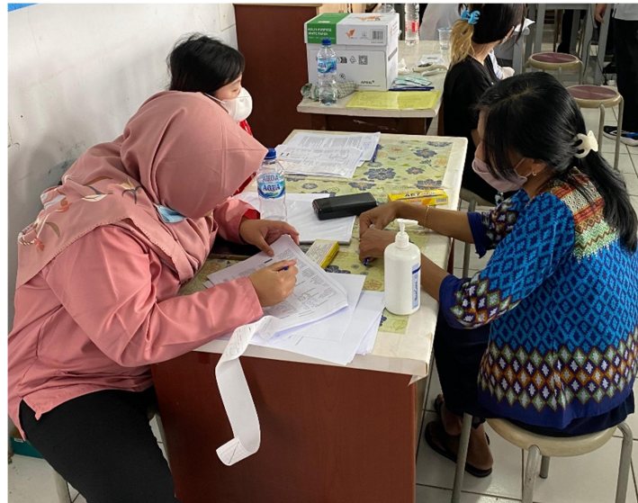
Gambar 2. Kegiatan Edukasi Mengenai Kesehatan Kulit