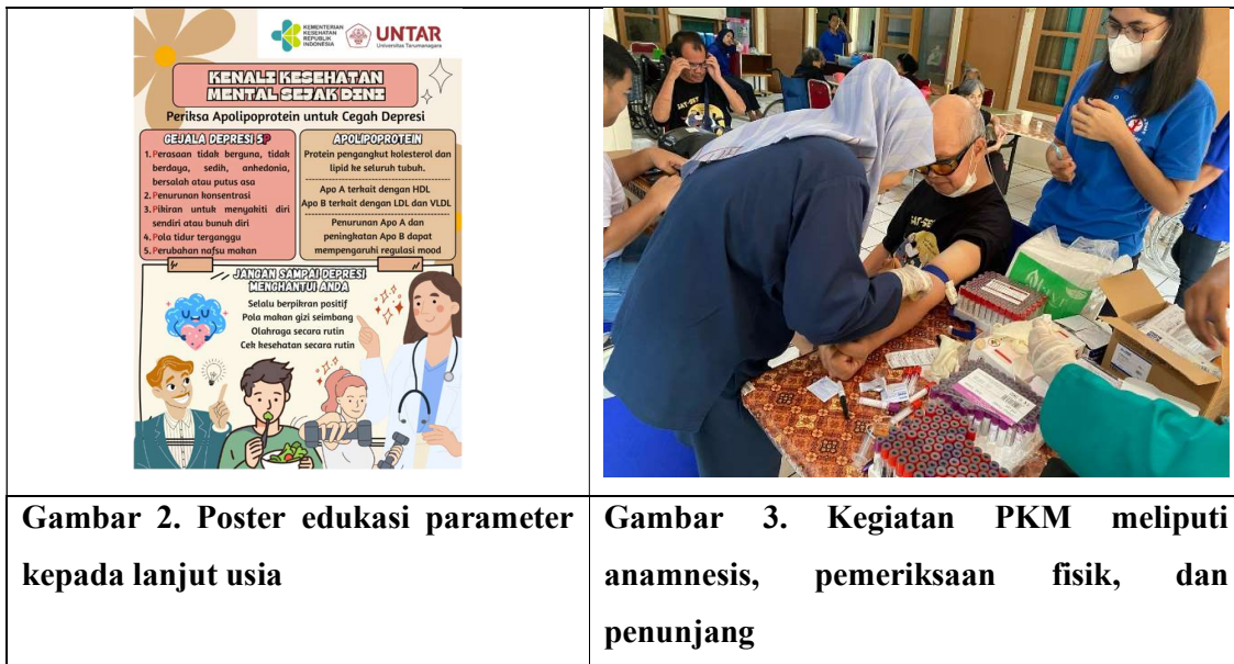
Gambar 2. Poster edukasi parameter kepada lanjut usia