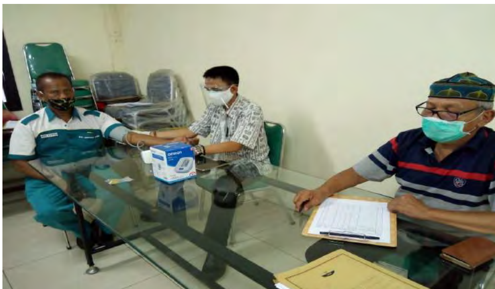
Gambar 1. Pengukuran Tekanan Darah

Kegiatan dilaksanakan mulai dari 28 September 2020 sampai 10 Oktober 2020 untuk pengukuran tekanan darah terhadap para sopir. 2019. Kegiatan dilaksanakan di perusahaan CV GM, Jakarta Timur yang diikuti oleh 118 peserta. Pengukuran dilakukan oleh tim pelaksana yang telah diberi pelatihan terlebih dahulu. Jumlah sopir yang berpartisipasi dibatasi per harinya, agar protokol kesehatan tetap dapat dijalankan.