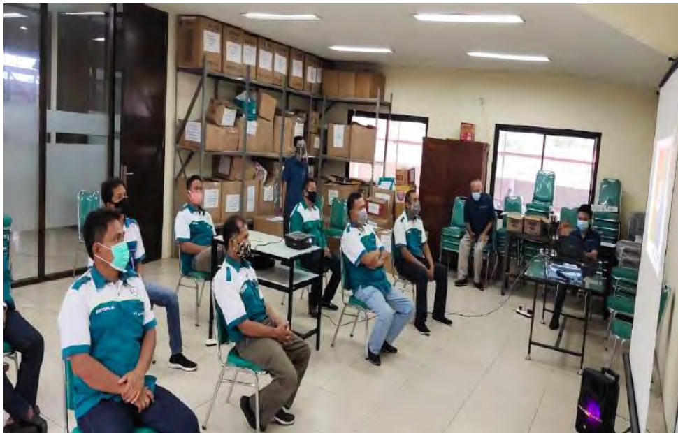
Gambar 2. Peserta Mendengarkan Pemaparan Materi.

Kegiatan penyuluhan kesehatan diberikan menggunakan media power-point dan disampaikan melalui media daring (zoom). Materi yang diberikan yaitu tentang hipertensi dan pola asupan gizi yang baik untuk mencegah dan mengatasi hipertensi: Dash diet dan pola hidup sehat yang sesuai untuk hipertensi. Tim akan menjelaskan mengenai hipertensi (faktor resiko, tanda dan gejala, bahaya, tata laksana terutama dari aspek gizi).