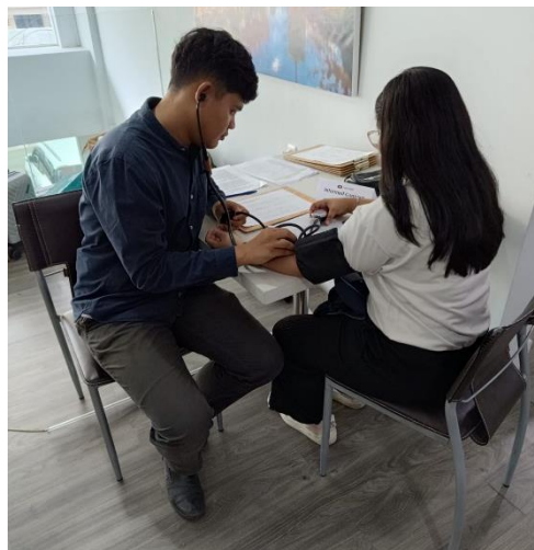
Gambar 1. Dokumentasi Pemeriksaan Tekanan Darah

Pelaksanaan kegiatan ini ditujukan kepada populasi dewasa di PT. Narindo, Jakarta Utara. Seluruh peserta mendapatkan pemeriksaan tekanan darah (Gambar 1). Karakteristik dasar responden dan hasil pengukuran tekanan darah (Tabel 1) dan klasifikasi tekanan darah tinggi responden (Gambar 2) dilampirkan.