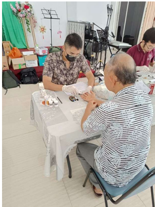
Gambar 1. Pemeriksaan Kadar Kolesterol Total

Kegiatan deteksi dini dilakukan di Panti Werda Hana, Tangerang Selatan yang ditujukan untuk populasi lansia, yang diikuti oleh 61 peserta. Seluruh peserta mendapat pemeriksaan darah berupa kadar kolesterol total (Gambar 1). Interpretasi hasil pemeriksaan kadar kolesterol total (Gambar 2) dilampirkan.