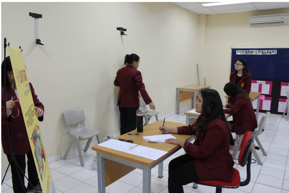
Gambar 4. Pelaksanaan Pengukuran Tinggi Badan