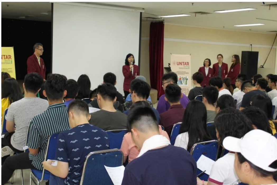
Gambar 2. Pembukaan Kegiatan yang Dilakukan oleh Dekan FK Untar

Hasil rerata pengukuran Lp baik remaja laki-laki dan perempuan dalam batas normal, namun didapatkan 15 (31,25%) siswa mempunyai Lp di atas normal. Hal ini menunjukkan terdapat obesitas sentral di mana dalam batas status gizi bisa saja normal tetapi terdapat penumpukan lemak dalam rongga perut. Keadaan ini perlu mendapat perhatian karena merupakan salah satu faktor mengalami penyakit tidak menular. Hasil pengukuran Lp siswa siswi ini dibandingkan dengan angka obesitas sentral di Indonesia (15,7%), angka kejadian obesitas sentral pada remaja ini cukup tinggi mencapai dua kali dari angka nasional. Untuk pengukuran obesitas sentral pada remaja putri didapatkan angka 16,21% masih di bawah jumlah angka nasional yaitu 46,7%. Angka nasional dapat saja lebih tinggi karena angka nasional meliputi seluruh populasi di Inonesia dengan umur \geq 15 tahun. Walaupun demikian, perlu diperhatikan agar dapat cepat ditangani untuk mencegah terjadinya penyakit tidak menular yang meliputi hipertensi, stroke, diabetes melitus dll.