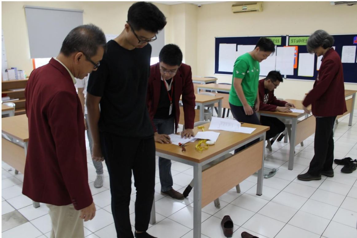
Gambar 3. Pelaksanaan Pengukuran Berat Badan