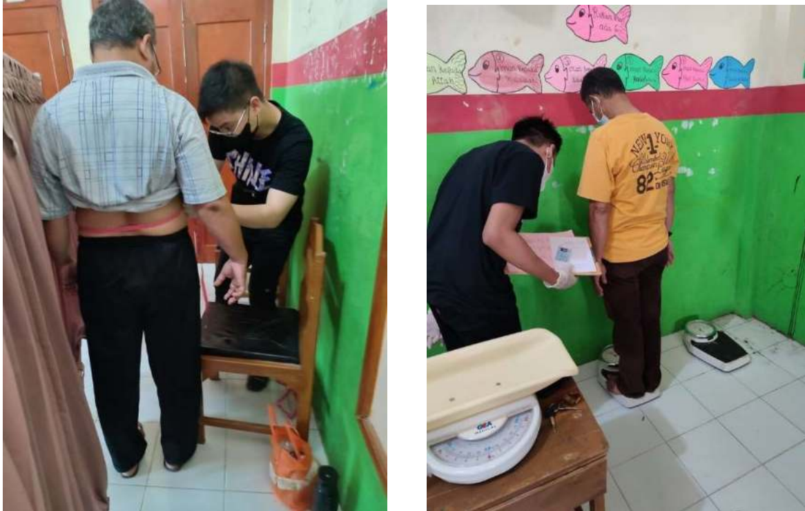
Gambar 2. Pengukuran Lingkaran Perut dan Berat Badan

Kegiatan dilaksanakan pada bulan Mei 2023 bertempat di desa Dalung, Serang Barat, dan dihadiri oleh 61 masyarakat setempat. Alat-alat yang digunakan berupa pita pengukur untuk mengukur lingkaran perut.