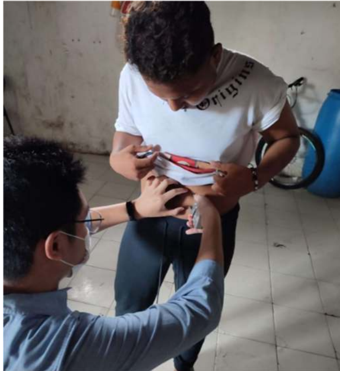
Gambar 1. Rangkaian Kegiatan Pengabdian Masyarakat

Kegiatan pengabdian Masyarakat ini dilaksanakan dengan melibatkan 37 responden. Rangkaian kegiatan pengabdian Masyarakat berupa penyuluhan, pemeriksaan fisik/ skrining, serta konsultasi kesehatan (Gambar 1). Karakteristik hasil demografi dan kegiatan pengabdian Masyarakat tersaji dalam Tabel 1