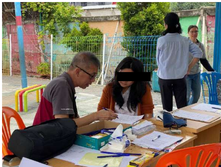
Gambar 2. Kegiatan Edukasi Mengenai Pentingnya Pemeriksaan Golongan Darah