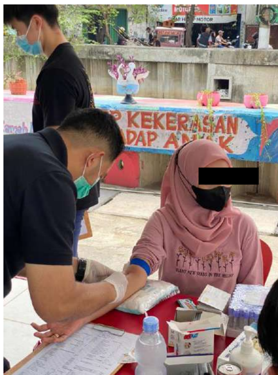
Gambar 2. Kegiatan Pengambilan Darah Untuk Pemeriksaan Penunjang