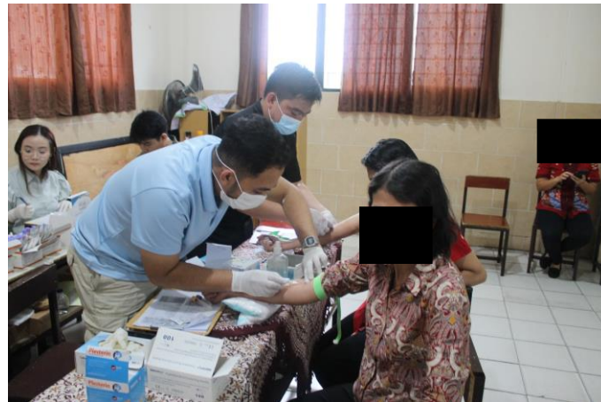
Gambar 2. Kegiatan Pengambilan Sampel Darah