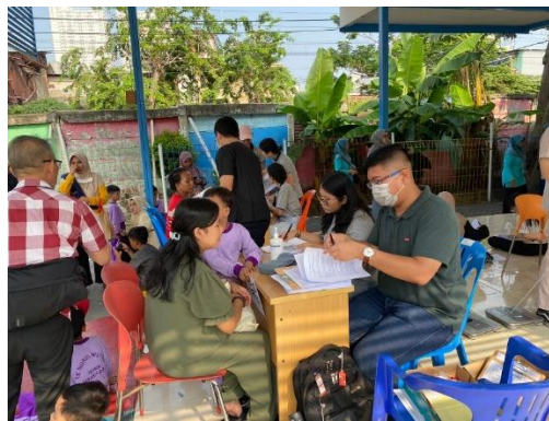
Gambar 2. Kegiatan Edukasi Kesehatan