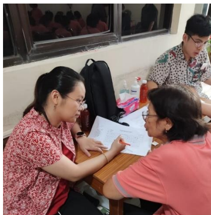
Gambar 1. Dokumentasi Pengisian Kuesioner Status Gizi menggunakan MNA

Kegiatan pengabdian penapisan status gizi yang ditujukan kepada populasi lanjut usia dilaksanakan di Gereja Fransiskus Asisi, yang mengikutsertakan 35 peserta. Seluruh peserta dilakukan wawancara mengenai status gizi (Gambar 1) dan kesimpulan hasil kuesioner penilaian status gizi (Gambar 2) dilampirkan.