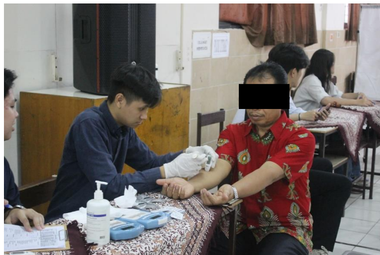
Gambar 2. Kegiatan Pemeriksaan Hidrasi Kulit