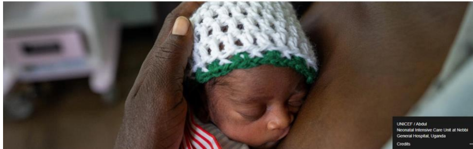
Neonatal Intensive Care Unit of Nebbi General Hospital, Uganda