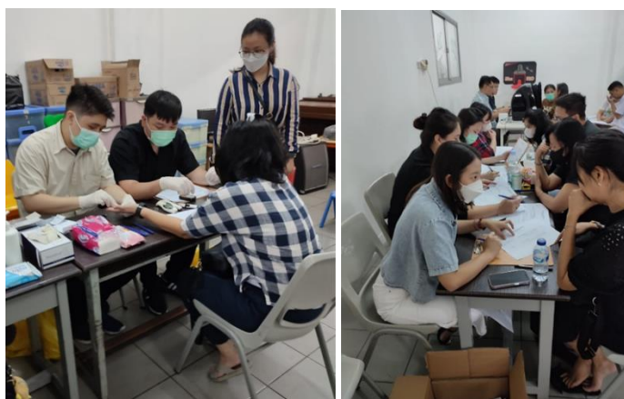
Gambar 1. Rangkaian Kegiatan di SMP Kalam Kudus