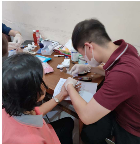
Gambar 1. Rangkaian Kegiatan Pengabdian Kepada Masyarakat

Kegiatan Pengabdian Kepada Masyarakat (PKM) ini dilaksanakan pada 14 Oktober 2023 dengan melibatkan 34 responden. Rangkaian kegiatan PKM berupa penyuluhan, pemeriksaan fisik/ skrining, serta konseling pribadi (Gambar 1). Karakteristik hasil demografi dan kegiatan PKM tersaji dalam Tabel 1