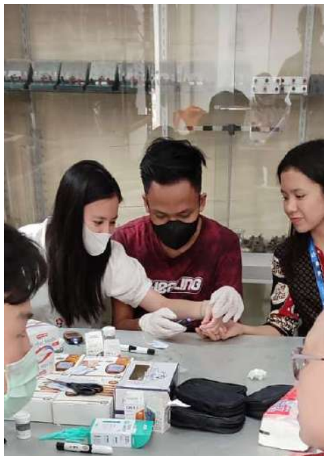
Gambar 2. Pelaksanaan Pemeriksaan Kesehatan dalam Pemeriksaan Darah