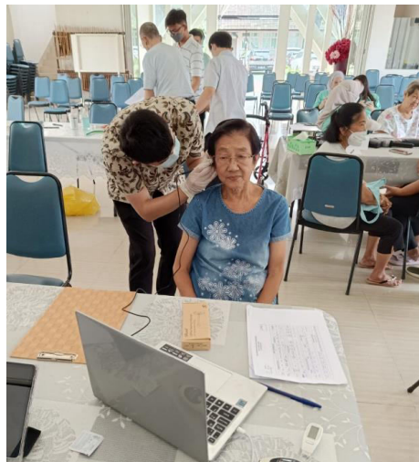
Gambar 1. Kegiatan Pemeriksaan Fisik pada Responden

Kegiatan Pengabdian Masyarakat ini dilakukan di Panti Werda Hana dengan mengikutsertakan 61 responden. Seluruh responden dilakukan pemeriksaan telinga terkait serumen dan membran timpani dengan menggunakan kamera otoskopi (Gambar 1). Seluruh hasil karakteristik dasar responden dan hasil pemeriksaan telinga terkait serumen dan gendang telinga tergambar dalam tabel 1.