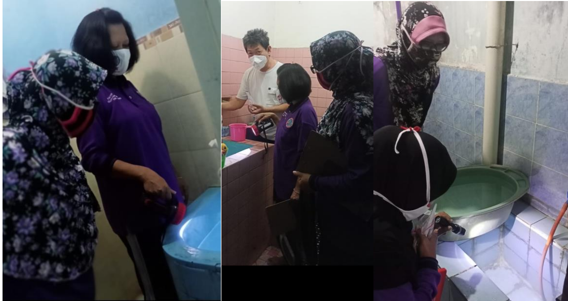
Gambar 5. Peserta Penyuluhan Sebagai Kader Jumantik