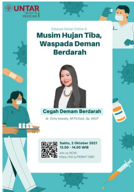
Gambar 1. Flyer Kegiatan