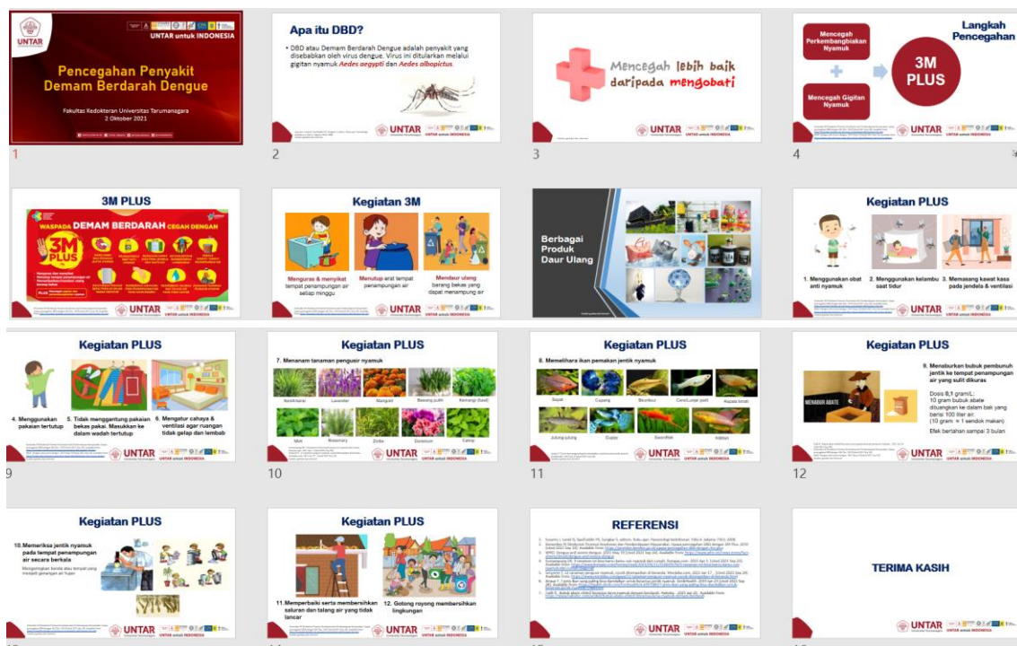
Gambar 2. Materi Kegiatan

Tujuan diadakan kegiatan pengabdian adalah meningkatkan kesadaran peserta dalam upaya pencegahan demam berdarah yang dapat diterapkan secara benar dalam kehidupan sehari-hari. Peserta pengabdian diterangkan oleh tim pengabdian tentang apa itu demam berdarah dengue, virus penyebabnya serta cara penularan. Tim pengabdian menyampaikan langkah pencegahan demam berdarah dengue serta 3M plus. Materi 3M plus disampaikan dengan gambar yang disertai keterangan agar kader jelas dengan kegiatan 3M plus. Tim juga mengingatkan ke peserta bahwa pencegahan demam berdarah lebih baik daripada mengobati.