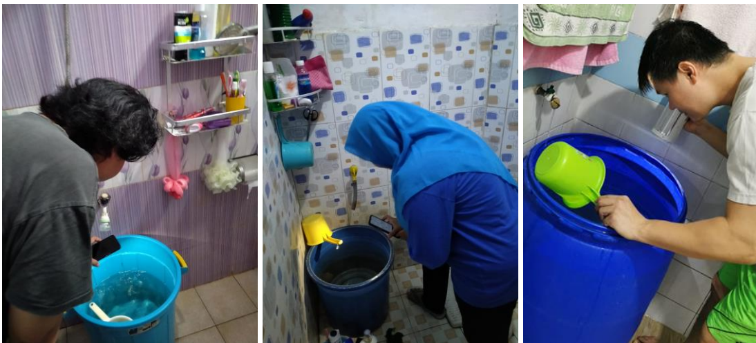
Gambar 4. Peserta Penyuluhan Melakukan Pemeriksaan Jentik Nyamuk

Selain peningkatan pengetahuan tentang pencegahan penyakit demam berdarah dengue, tim pengabdian juga mengharapkan perubahan perilaku yang positif dari peserta kegiatan dengan rutin mempraktikkan langkah pencegahan melalui gerakan pemberantasan sarang nyamuk 3M plus. Oleh karena itu, seminggu setelah kegiatan penyuluhan, tim pengabdian melakukan follow up ke peserta dengan menanyakan kegiatan pencegahan demam berdarah dengue yang telah dilakukan. Peserta kemudian mendokumentasikan kegiatan pemeriksaan jentik nyamuk sebagai salah satu gerakan 3M plus. Para peserta kegiatan juga diharapkan menjadi kader jumantik yang aktif mempromosikan pencegahan penyakit demam berdarah dengue sehingga kasus demam berdarah dengue di wilayah Tomang Jakarta Barat dapat menurun.