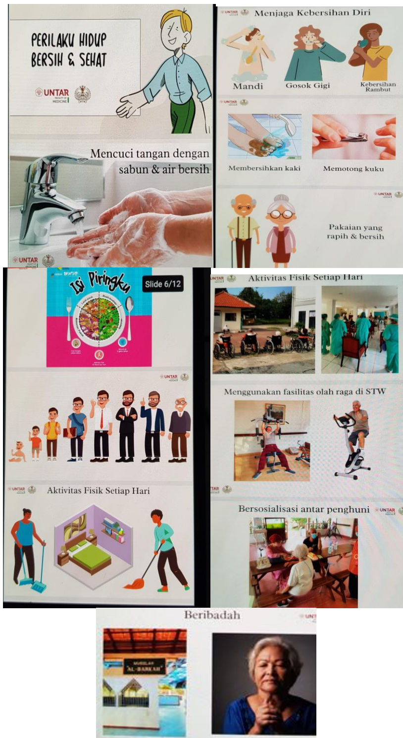
Gambar 2. Materi penyuluhan PHBS

Cibubur, tetap bersosialisasi tetapi memperhatikan protokol kesehatan dan tetap berdoa. Tim pengabdian melakukan pemutaran video tentang “Mencuci tangan 6 langkah”, peserta juga ikut mempraktekkan teknik cuci tangan dengan semangat. Kegiatan penyuluhan yang dilakukan secara luring tetap menerapkan protokol kesehatan yaitu memakai masker dengan tepat serta duduk antara peserta diberi jarak sesuai anjuran. Acara kegiatan dapat dilihat pada gambar 2.