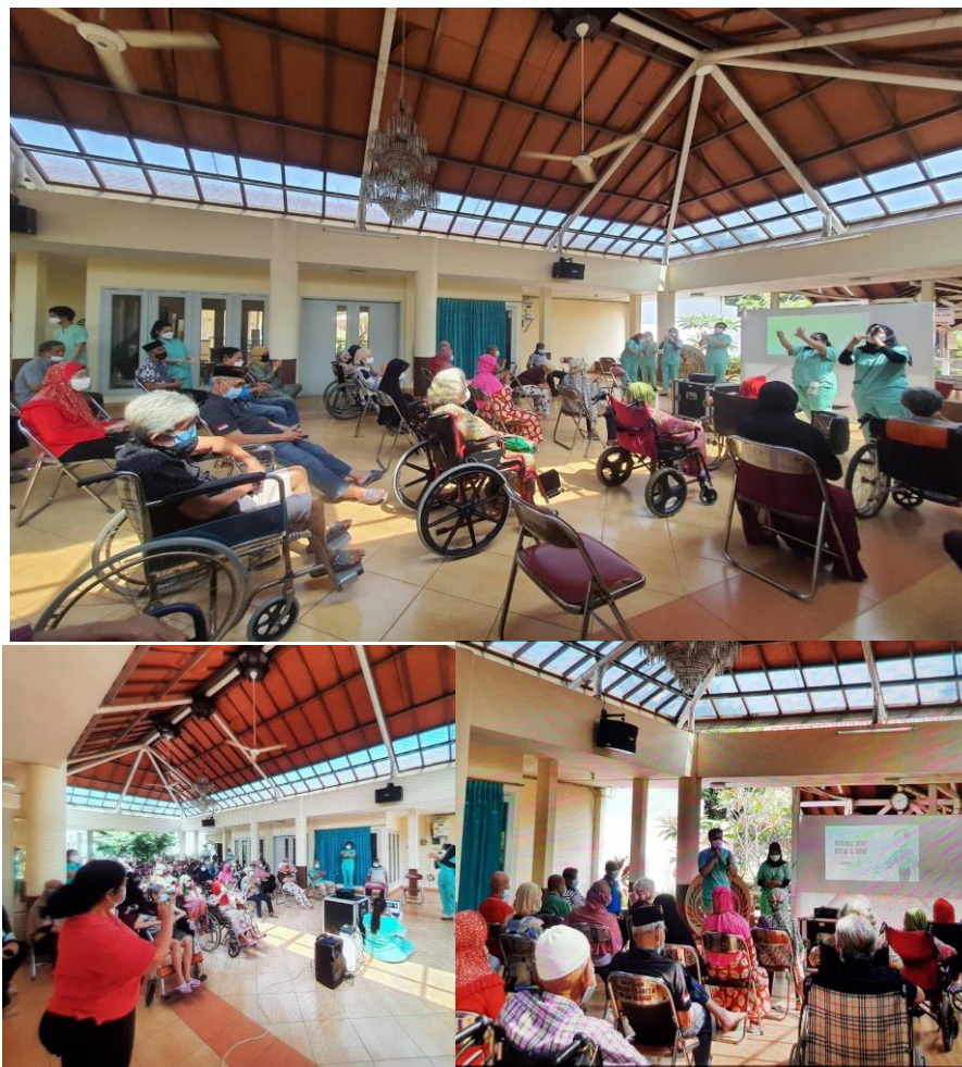
Gambar 3. Acara penyuluhan dan cuci tangan

Penerapan Perilaku Hidup Sehat Dan Bersih pada lansia adalah bagian dari program Gerakan Masyarakat Hidup Sehat (GERMAS) yang diterapkan oleh pemerintah. Peningkatan pengetahuan PHBS pada lanjut usia adalah upaya agar lansia dapat mandiri, tidak bergantung dengan orang lain serta mampu menjaga kesehatan serta kebersihan dirinya agar terhindar dari paparan penyakit. (Kauman, 2019).