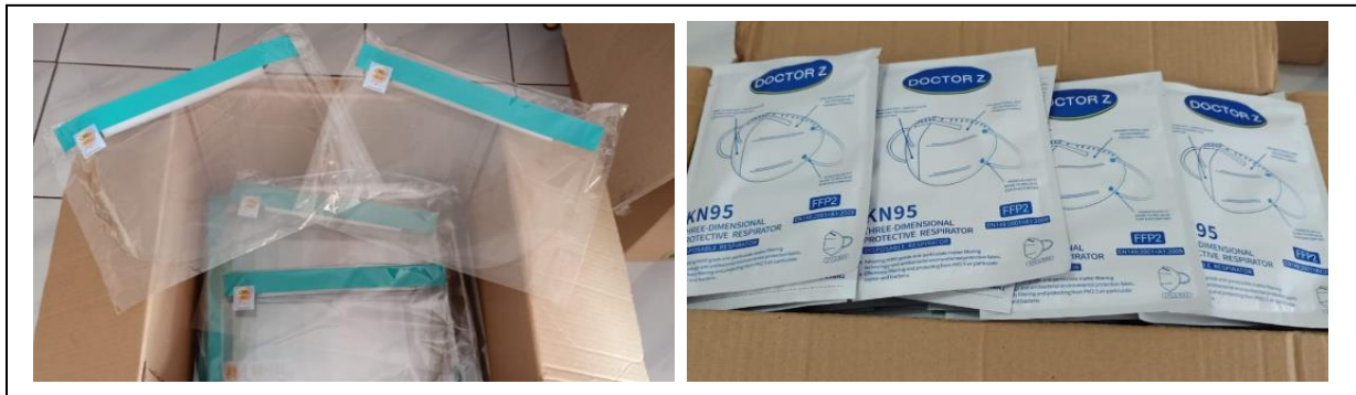
Gambar 1. Sebagian donasi berupa face shield dan masker N95 yang terkumpul.

Kedua permasalahan ini menggugah para alumni FK UNTAR yg tergabung dalam keluarga alumni medis Universitas Tarumanagara untuk menggalang dana. Penggalangan dana yang merupakan kerjasama antara FK.UNTAR dan alumni berhasil mengumpulkan dana dari alumni, mahasiswa FK UNTAR dan orang2 di luar FK.UNTAR. Selain dalam bentuk uang, donasi yang diterima berupa APD (Coverall, masker N95, KN95, hand sanitizer , face shield , masker bedah, google ) dan paket makanan. (Gambar 1)