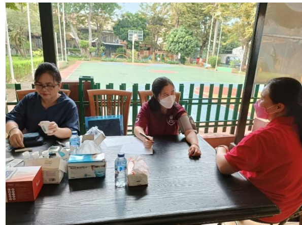
Kegiatan PKM di Posbindu Rosella