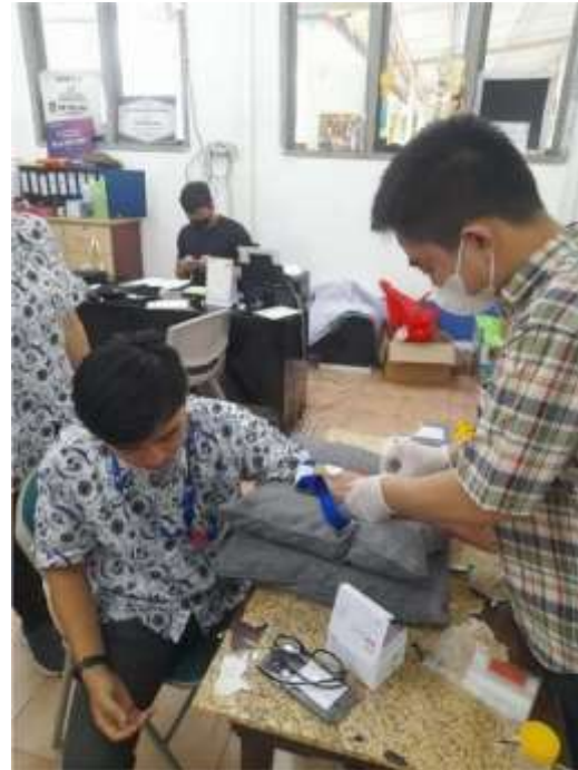
Gambar 2. Kegiatan pemeriksaan darah