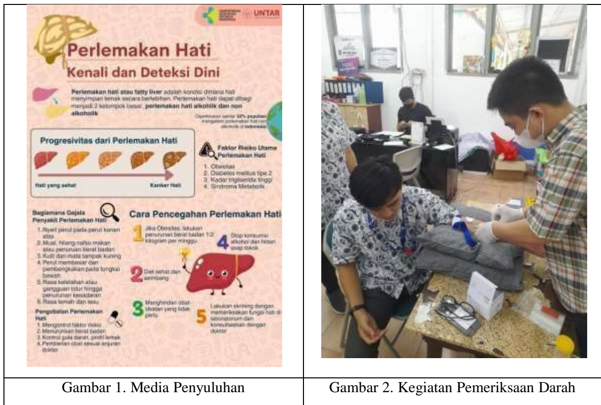
Gambar 1. Media Penyuluhan