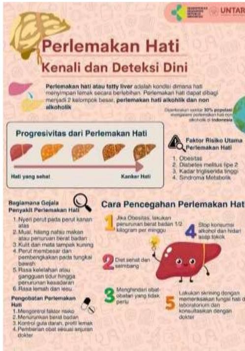
Gambar 1. Media penyuluhan