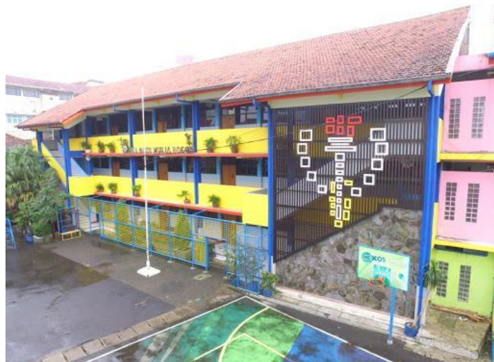
Gambar 1. Sekolah Menengah Atas Budi Mulia Bogor

Sekolah Menengah Umum Budi Mulia Bogor yang terletak di jalan kapten Muslihat Bogor dengan jumlah siswa kelas X dan XI 419 orang yang terdiri dari 219 siswi dan 200 siswa. Para remaja ini perlu diberikan pemahaman mengenai perubahan seksual dan perilaku seksual yang benar sehingga tidak melakukan penyimpangan.