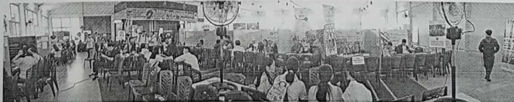
Stand Untar dibagian Tengah