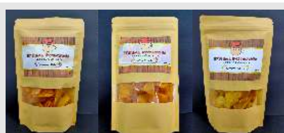
Gambar 3.1. Produk D’Real Potatoes

Alamat website D’Real Potatoes adalah: www.drealpotatoes.com , seperti yang disajikan pada gambar 3.2 berikut ini yang merupakan tampilan di ponsel: