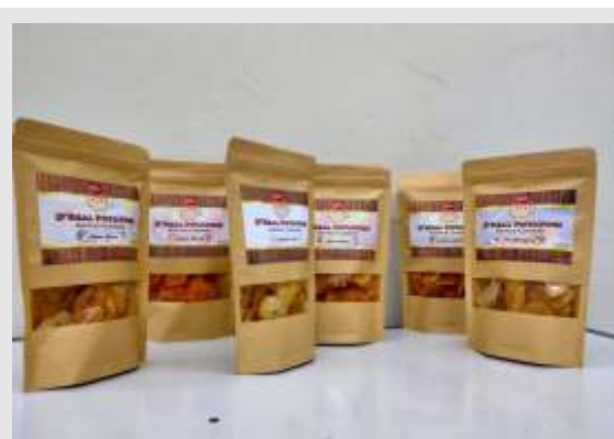
Gambar 2.1. Produk D'Real Potatoes

Keripik ini terdiri atas enam macam rasa yaitu: ayam bakar, sambal balado, original salt, keju manis, pizza dan jagung bakar, seperti yang ditampilkan pada gambar 2.1. berikut ini: