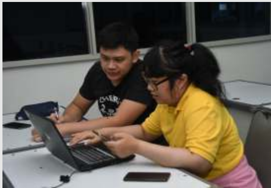
Gambar 3.3. Pelatihan Dilakukan Secara Intens

ini juga telah dilatih selaku administrator seperti ditampilkan pada Gambar 3.3. agar dapat memperbarui isi website, terutama mengenai informasi ketersediaan produk serta info-info lain seperti event yang diikuti D'Real Potatoes. Acara yang menjadi sasaran untuk diikuti adalah bazaar yang kerap diadakan di kampus atau pentas seni mahasiswa.