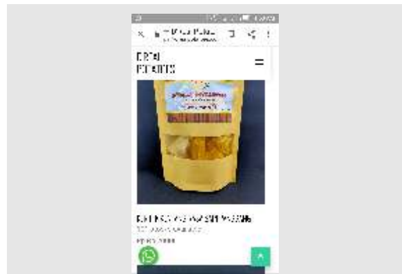
Gambar 3.5. Tampilan Harga Produk dan Ketersediaan

Harga memang hal yang amat sensitif. Melalui diskusi yang intens dengan Daniel, harga yang ditampilkan juga akan menampilkan tawaran potongan harga jika dilakukan pemesanan dalam jumlah tertentu.