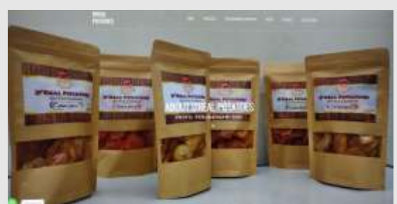
Gambar 3.6. Tampilan Website Harga dan Ketersediaan Produk

Pada gambar 3.6. disajikan tampilan website D'Real Potatoes secara utuh dari layar monitor komputer yang menampilkan menu: home, products, recommended products, about, contact dan seller login .