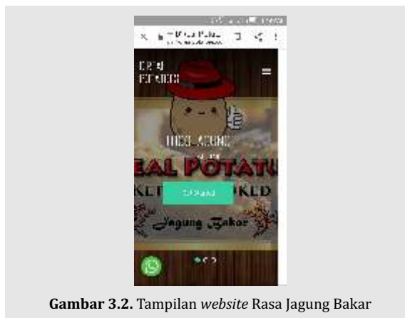
Gambar 3.2. Tampilan website Rasa Jagung Bakar

Tampilan seperti yang disajikan pada gambar 3.2. memang belum sempurna, seperti masih tampak tulisan “logo jagung”. Tampilan tersebut merupakan screenshot dari ponsel. Diharapkan calon konsumen D’Real Potatoes dapat mengakses dari ponselnya sekaligus melakukan pemesanan secara langsung, walaupun transaksi penjualan masih dijalankan secara konvensional, yaitu transfer via atm atau mobile banking .