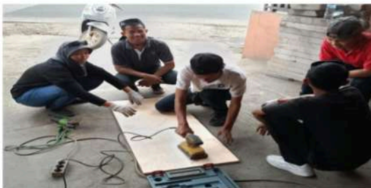
Gambar 16. Mengampelas Alas Meja Bar yang Terbuat Dari Kayu