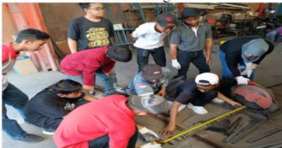
Gambar 8. Pengukuran Panjang Bahan