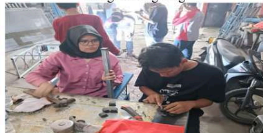
Gambar 17. Menyesuaikan Ukuran Karet Alas Meja Bar