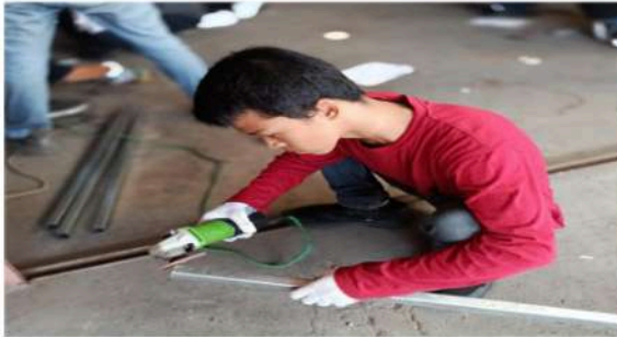
Gambar 10. Menggunakan Gerinda Tangan