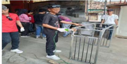
Gambar 14. Merapikan Kampuh Lasan