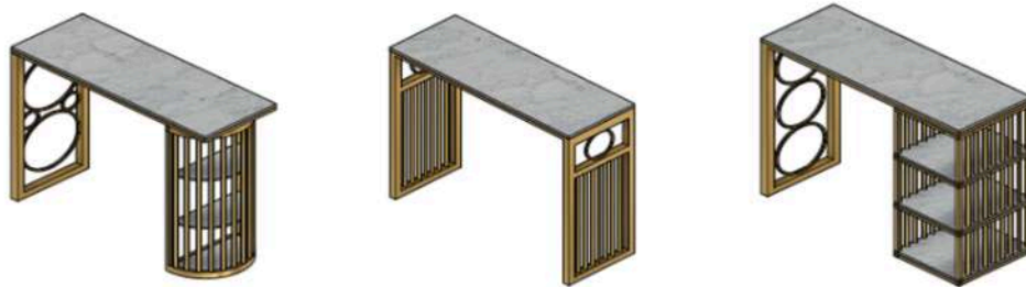
Gambar 5. Beberapa Disain Meja Bar Minimalis Ergonomis Hasil Rancangan.

Proses pembuatan meja bar menggunakan bahan besi hollow, besi nako dan kayu. Adapun proses yang dilalui antara lain proses pengukuran dimensi komponen penyusun produk meja bar, proses pemotongan bahan menggunakan gerinda duduk, proses merapikan ujung bahan hasil pemotongan untuk proses penyiapan kampuh lasan, proses pengerolan, proses pengelasan, proses menggerinda kampuh hasil lasan yang kurang rapi, penyesuaian kembali ukuran dan ketelitian sambungan serta proses pengecatan.