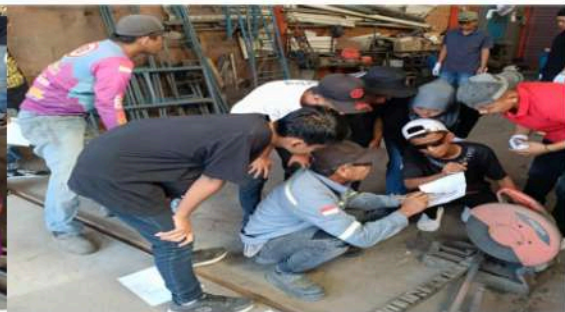
Gambar 7. Petunjuk Cara Membaca Gambar Oleh Insruktur Bengkel