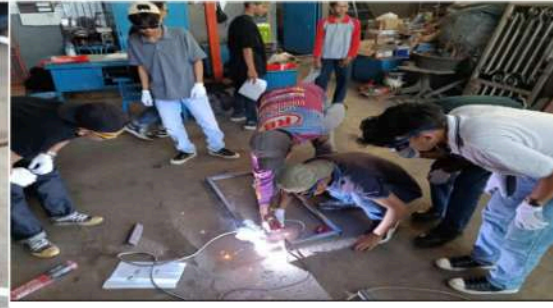
Gambar 11. Petunjuk Cara Mengelas Oleh Instruktur