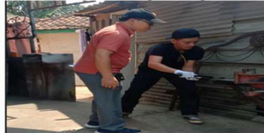
Gambar 15. Mengerol Bahan Untuk Komponen Yang Melengkung