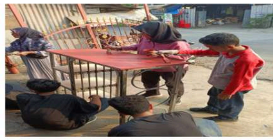
Gambar 19. Mengecat Meja Bar