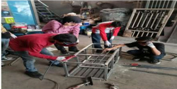
Gambar 12. Peserta Mengelas Rangka Utama