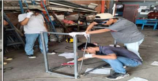
Gambar 13. Peserta Mengelas Rangka Utama