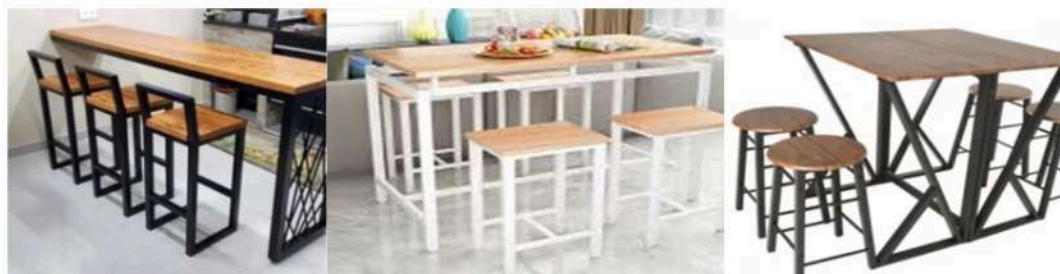
Gambar 4. Beberapa Contoh Disain Meja Bar Minimalis Ergonomis .

Disain juga telah mempertimbangkan kenyamanan pengguna saat menggunakan meja bar tersebut. Berdasarkan diagram pohon, dapat dihasilkan sebanyak 2 \times 2 \times 2 \times 2 = 16 alternatif. Namun dari semua alternatif tersebut dipertimbangkan 3 konsep yang paling layak dan cukup mudah untuk dibuat saat pelatihan. Beberapa hasil rancangan disajikan pada gambar 5.