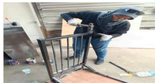
Gambar 18. Memasang Karet Kaki Meja Bar