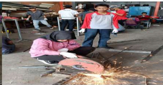
Gambar 9. Proses Pemotongan Bahan Menggunakan Mesin gerinda Duduk