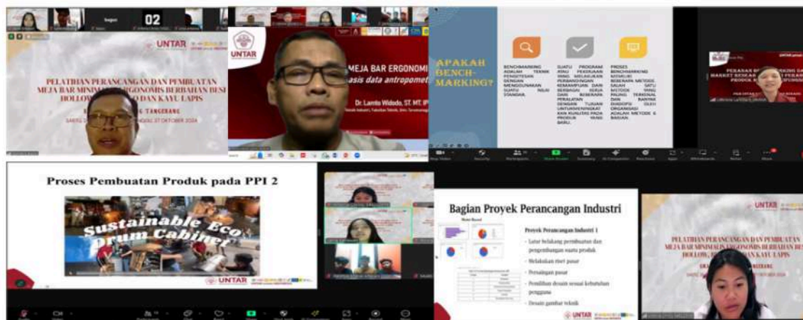
Gambar. 1. Pembekalan Teori dan Wawasan serta Cara Penggunaan Peralatan Bengkel