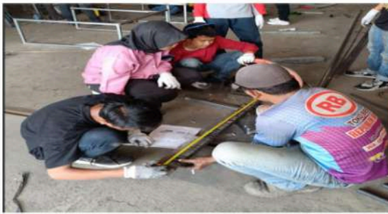
Gambar 6. Petunjuk Cara Mengukur Oleh Insruktur Bengkel

Pada proses pembuatan produk menggunakan peralatan bengkel di bengkel las, para peserta dibagi ke dalam beberapa kelompok. Dengan demikian para peserta akan bekerjasama saling membantu dalam proses pembuatan produknya sampai selesai. Tahap akhir berupa pengisian kuisioner tahap 2 untuk mengukur capaian pelatihan tersebut. Gambaran jalannya kegiatan pelatihan disajikan pada rangkaian gambar di bawah ini.