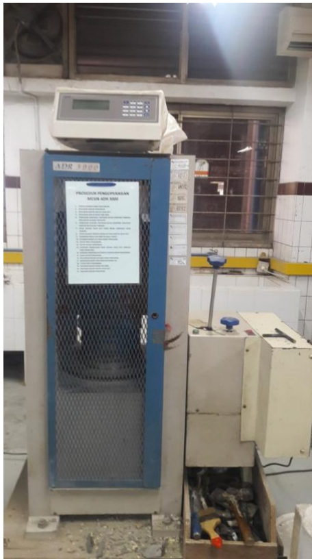
Gambar 3.1 Mesin Uji Tekan

Compression Machine merupakan peralatan yang biasa digunakan untuk mengukur gaya maksimal yang mampu di pikul sampel beton, seperti ditunjukkan pada Gambar 3.1.