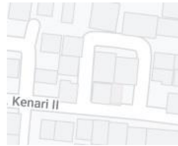
Gambar 2. Fasum-Fasos (RT 04 RW 11) untuk lapangan orah raga badminton, tempat bermain dan bertanam sayuran