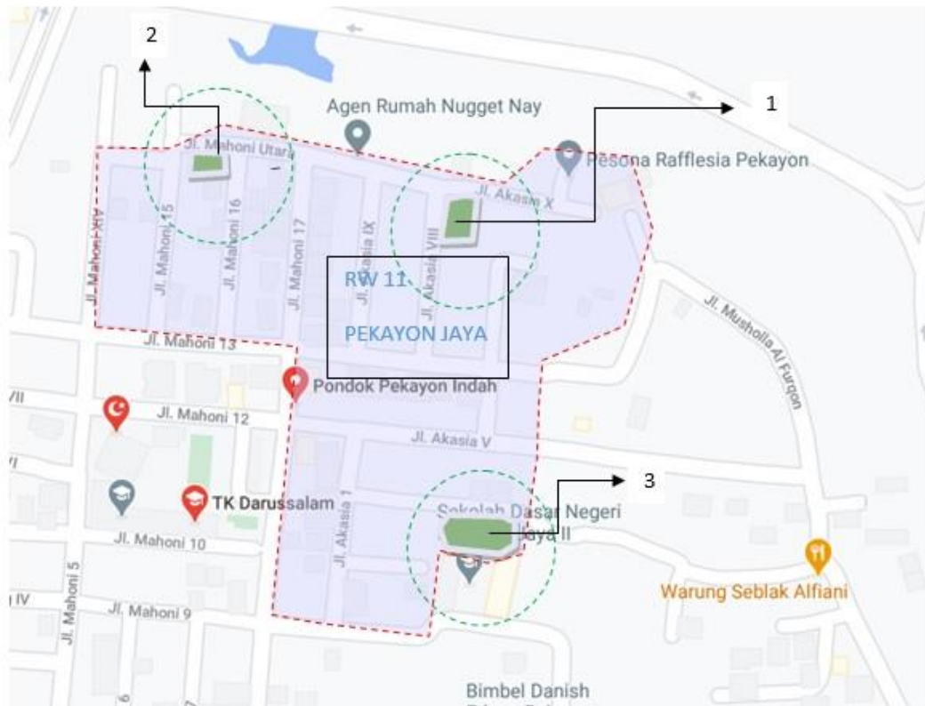
Gambar 1. Lokasi RW 11 beserta posisi Fasum dan Fasos

Oleh karena itu, Pengurus RW 11 yang mewakili warga RW 11 mengajukan permohonan bantuan desain. Di RW 11 ada 3 fasum yang memungkinkan dapat ditindaklanjuti program Ketahanan Pangan Lingkungan yaitu berada di lokasi RT1, RT 04 dan RT 2. (lihat gambar 1. Lokasi RW 11), namun pada tahap ini, baru dilakukan PKM untuk RT 04 RW 11. Rencana PKM akan dilakukan secara berkelanjutan di wilayah RW 11 lainnya yaitu RT 1 dan RT 2.