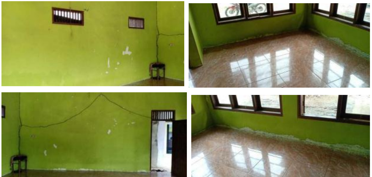
Gambar 2. Interior Majelis Taklim sebelum Tahap Pelaksanaan

Tahap pra pelaksanaan yang diawali dengan diskusi bersama Mitra yaitu Bapak Patudin, selaku ketua RT 04, RW 01, Desa Kebasiran, Parung Panjang. Pada tahap ini direncanakan untuk pengecatan dinding bagian dalam dan bagian luar. Proses pengecatan berlangsung satu minggu. Pada proses pengecatan tim dibantu oleh satu orang tukang yang berasal dari warga sekitar Majelis Taklim.