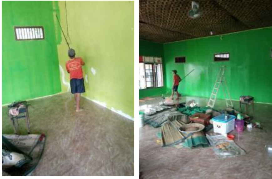
Gambar 3. Tahap Pelaksanaan Pengecatan Interior

Penataan furniture pada Majelis Taklim meliputi; rak buku, lemari, meja lipat dan white board .